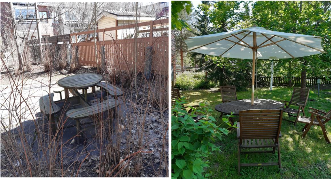
Huhtikuussa Verson puutarha on heräämisvaiheessa ja kesä-elokuussa täydessä kukoistuksessaan

Tilanteen mukaan yhdistys tarjoaa toimintaa kasvatusten sekä etänä. Toukokuusta alkaen Valtakadun puutarhassa on turvallista tavata ja kokoontua. Pienet ryhmät voivat kokoontua myös sisätiloissa. Olohuonetoiminta on toistaiseksi tauolla. On koettu, että laitteet eivät korvaa ihmistä, mutta ne antavat mahdollisuuksia ja vaihtoehtoja. Digitoimintoihin panostamisen lisäksi Versossa otetaan mahdollisimman hyvin huomioon ekologiset ja ympäristöä säästävät valinnat. Seniori- ja nuorten aikuisten ryhmätoimintaa käynnistetään mahdollisimman pian.