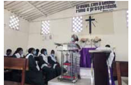
ETIOPIA Toimeentulon vahvistaminen ilmastonmuutoksen keskellä Amharassa. ANGOLA Teologisen koulutuksen vahvistaminen