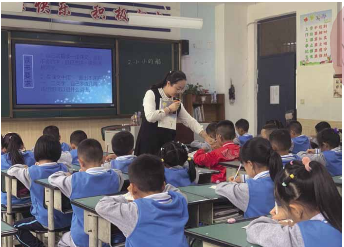
Kiina: kuurojen luokka opiskelee.

matta työmme saattoi jatkua vuonna 2022, vaikka tilapäisiä rajoitteita onkin voinut tulla. Esimerkiksi kuurojen oppilaiden inklusiivinen opetus on jatkunut koronan tuomista haasteita huolimatta. Kiinassa kuuroutta on perinteisesti pidetty tabuna. Kun Lähetysseura aloitti vuosia sitten kuurojen lasten inklusiivisen opetuksen kehittämisen yhdessä Amity Foundationin (Ystävyyden säätiö) kanssa, viittomia ei Kiinassa juuri käytetty. Sittemmin hanke on saanut laajaa kannatusta useista kouluista, luokassa käytetään viittomia yhdessä sisäkorvaimplanttien kanssa ja hiljattain palkattiin jopa kaksi ensimmäistä kuuroa opettajaa, Kiinan ensimmäiset kuurot opetta-