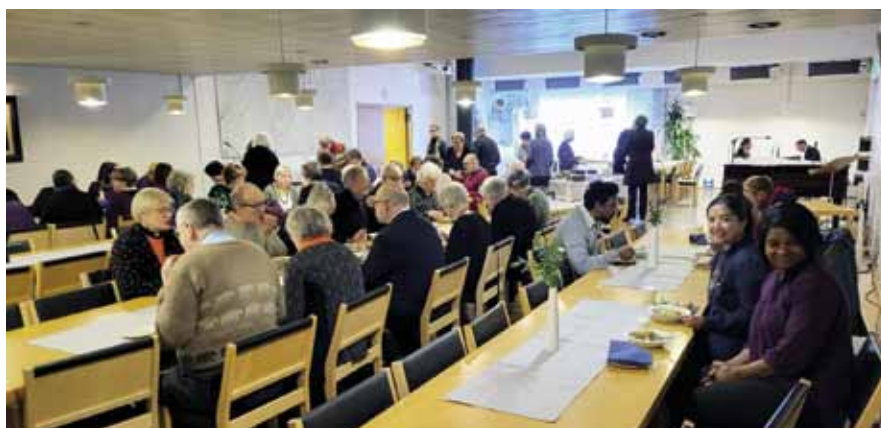
Lähetyslounas Seinäjoella