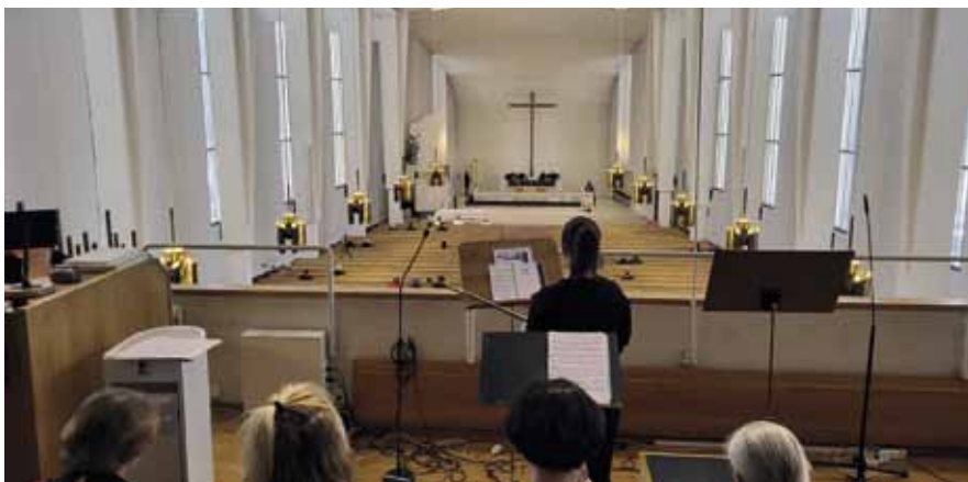
Seinäjoen Lakeuden Risti on Alvar Aallon suunnittelema kirkko, joka valmistui vuonna 1960.