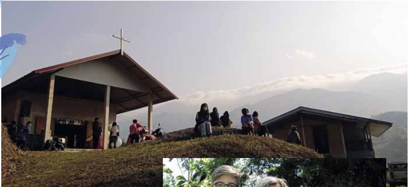
Kotikylämme uusi kirkko.

kun kuuma kausi on huipussaan ja päivälämpötilat nousevat 40 asteeseen, ensimmäiset ukkosmyrskyt ja sateet ovat suuri taivaan lahja: rankkasateiden myötä ilma voi jälleen puhdistua ja raikastua kaikesta savusta ja saasteesta.