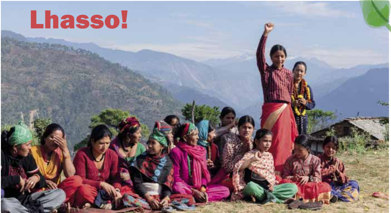
Nepal: Shyal Dadhan nuorten ryhmä kokoontuu.

Lhasso on tamangin kieltä. Se on yleinen tervehdys Kathmandusta itään. Se tarkoittaa samaa kuin ”namaste” nepaliksi.