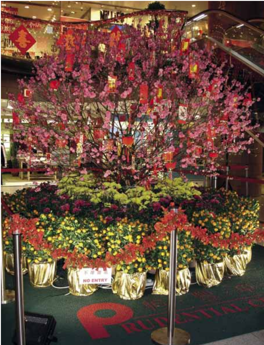
Uudenvuoden onnenpuu Hongkongissa.

meihin vaikuttaakaan se maaperä, jossa olemme kasvaneet. Vertaus kuuluu näin: Kun paikalle tuli paljon väkeä ja kaikista kaupungeista virtasi ihmisiä Jeesuksen luo, hän esitti heille vertauksen: »Mies lähti kylvämään siementä. Kun hän kylvi, osa siemenestä putosi tien laitaan. Siinä jyvät tallautuivat, ja taivaan linnut söivät ne. Osa putosi kalliolle ja lähti kasvuun, mutta oraat kuivettuivat, koska eivät saa-