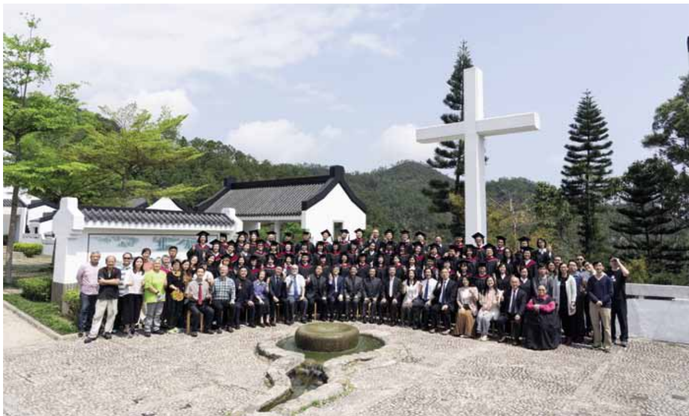
Hongkong: valmistuneita opiskelijoita Hongkongin teologisella seminaarilla.