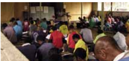
PAPUA-UUSI-GUINEA Raamatunkääntäminen ja kristillinen kirjallisuustyö