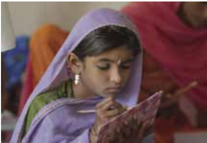
Peshawarin hiippakunnan lukutaitotyö, PAKISTAN Naisten lukutaidon ja elämän hallinnan parantaminen