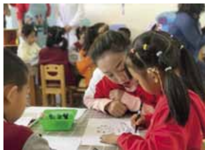
Erityisopetuksen kehittäminen Syrjittyjen lasten hyvinvoinnin parantaminen. Vaikeissa oloissa elävien lapsiperheiden tukeminen