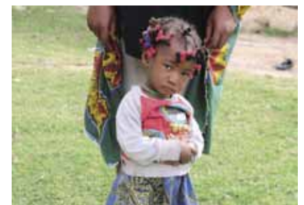
Lasten pankki toimii eri maissa.

Kiitos tuestasi nimikkolähetille ja nimikkokohteille! Hyvää ja aurinkoista kesää kaikille lukijoille!