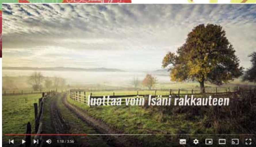
SILMÄNI AUKAISE (3-6lk)