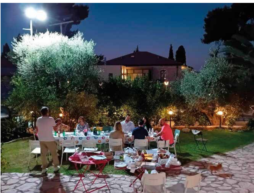
Yhteinen illanvietto FELM-keskuksella.

Lähi-idän ja Latinalaisen Amerikan aluejohtaja, Suomen Lähetysseura