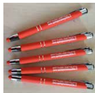
Kynä 2 € / kpl.