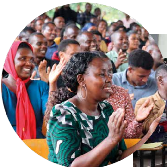
Joulukuun työpaja Tansaniassa.

Teksti ja kuvat: Linda Juntunen, itäisen ja eteläisen Afrikan viestinnän asiantuntija