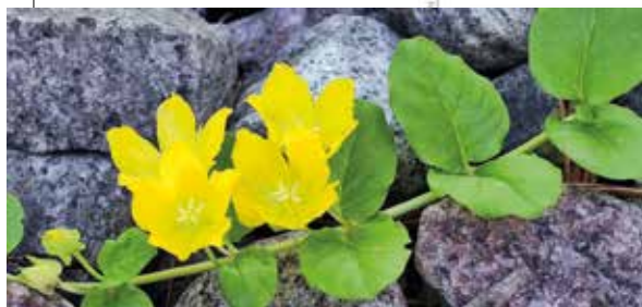
Kortit, painetut 1 € / kpl