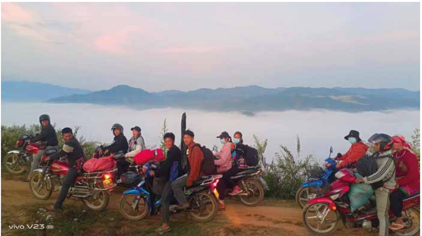
Kylämatkalla jouluna.