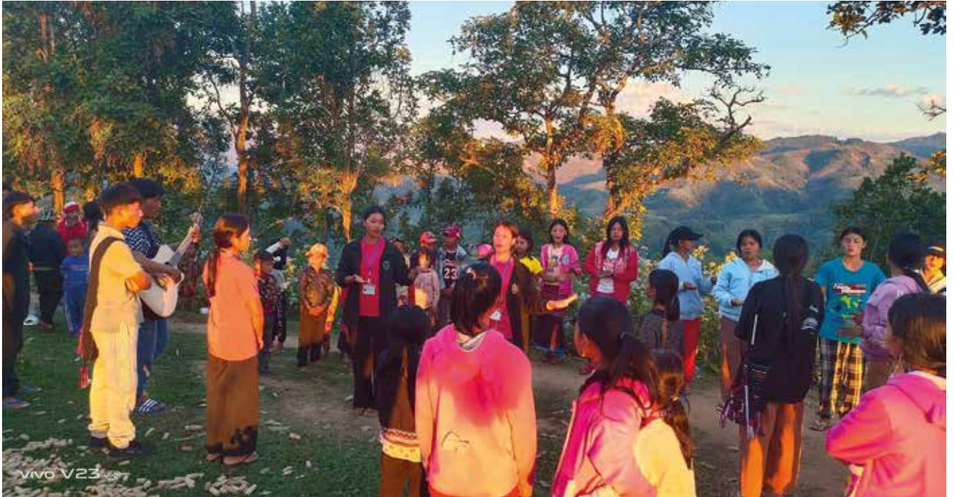
Ihmisiä koolla jouluna.

ake on ns. SOV-kieli. Englanti, samoin kuin suomi, ovat SVO-kieliä. Se tarkoittaa sitä, että näissä kielissä subjekti, objekti ja verbi ovat eri järjestyksessä. Toisin sanoen, kun suomeksi sanottaisiin että "Minä menen kauppaan", niin akeksi vastaava sanottaisiin: "Minä kauppaan menen". Tämä vaikuttaa myös lauseiden keskinäiseen järjestykseen niin, että kun suomeksi yleensä päälause tulee ensin ja sivulause seuraa sitä, niin akeksi lauseet menevät päinvastoin. Eli jos suomeksi sanottaisiin "Jään huomenna kotiin, sillä minulla on töistä vapaata", akeksi sanottaisiin: "Huomenna minulla töistä vapaata on, joten kotiin jään." Tämä SOV vaikuttaa siis lauserakenteisiin ja joskus jopa Raamatun jakeisiin niin, että olemme joutuneet yhdistämään jakeita, jotta niiden sisällä oleva informaatio