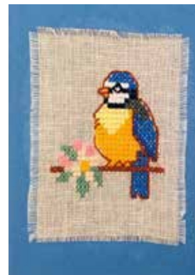
Ristipistokortit, Etiopia 5 € / kpl Kortit ovat uniikkeja, joten saa- masi versio voi poiketa kuvan malleista.