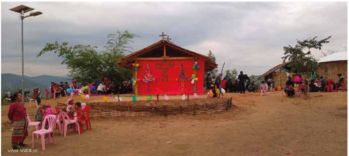
Syrjäkylän kirkko.