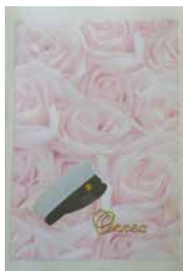
Käsintehty onnittelukortit, esim. ylioppilaalle 3 € / kpl Kortit ovat uniikkeja, joten saa- masi versio voi poiketa kuvan malleista.