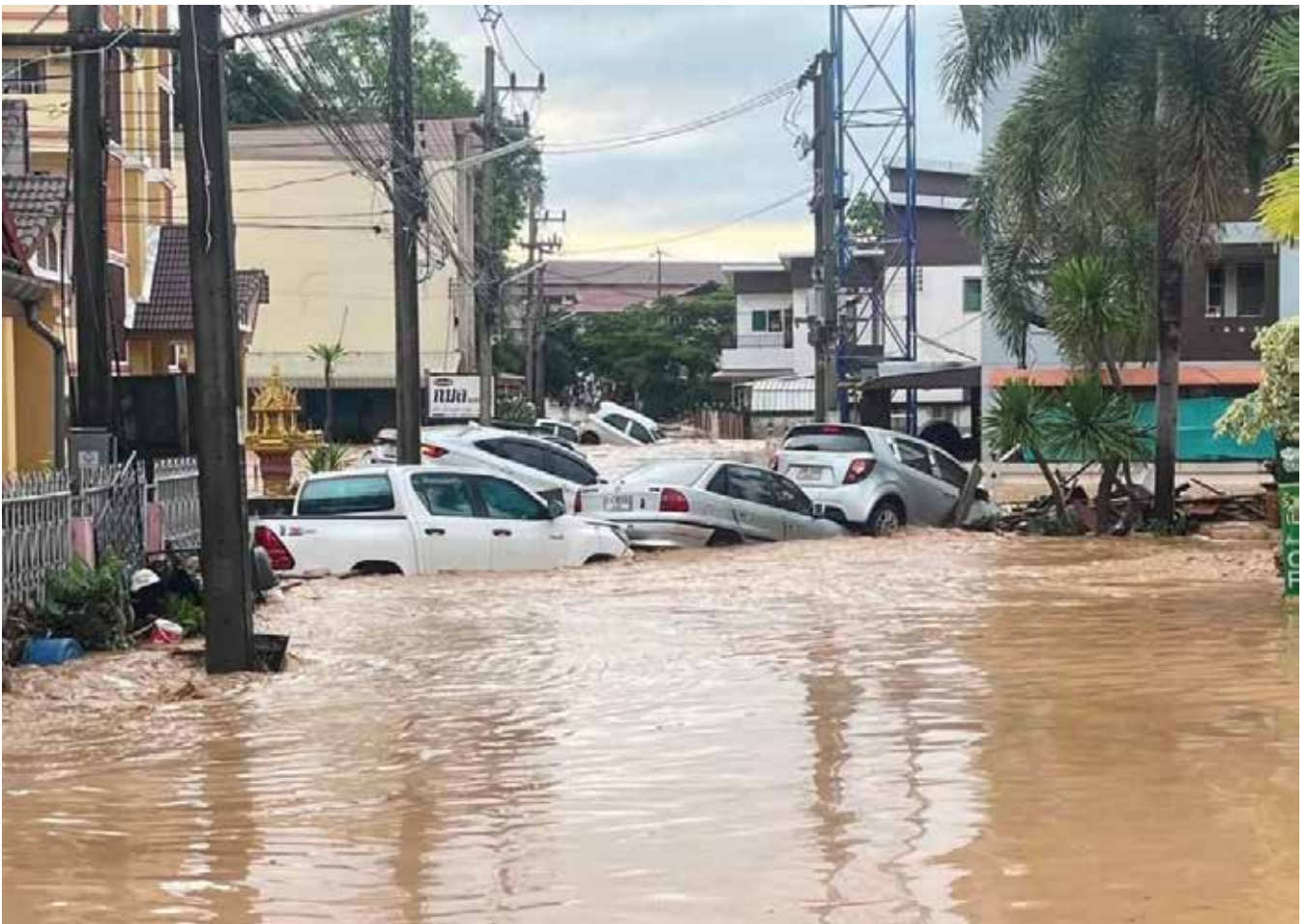
Lähes 20 000 ihmistä menetti kotinsa ja omaisuutensa Chiang Rain tulvissa syksyllä.

deistaan, kun tulvavedet peittivät alleen niin talot, autot kuin irtaimistonkin. Toisaalla osa ihmisistä taas jäi loukkuun omiin koteihinsa, kun tulvavesi tukki kaikki poistumistiet. Juomaveden, ruoan ja sähkön loppuminen aiheuttikin monille asukkaille suuria ongelmia ja pelastusoperaatioihin hälytettiin lukuisia viranomaisia, avustusjärjestöjä sekä armeijan henkilökuntaa eri puolilta maata.