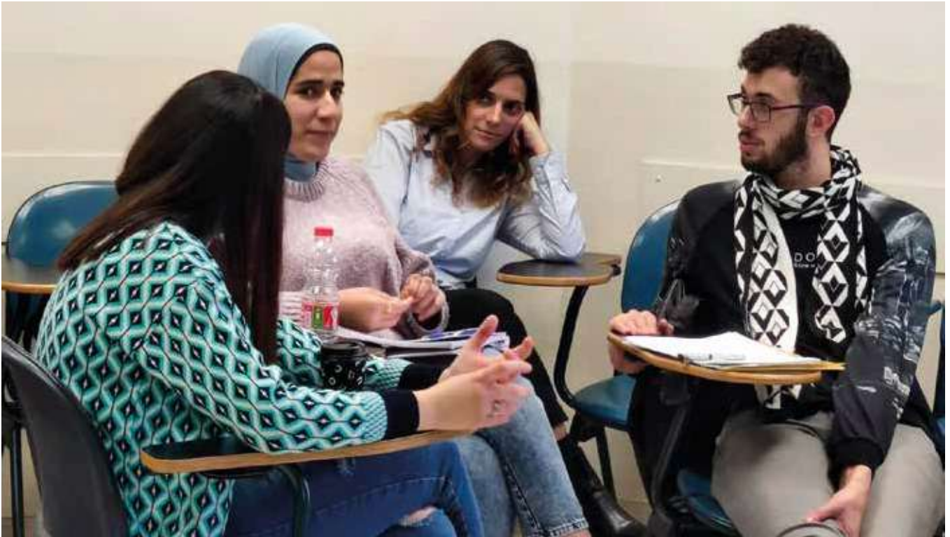
Opettajankoulutuksen opiskelijoita Educating for Change -kursilla.

Toiseksi tapahtuu UNLEARNING eli meidän on opittava eroon niistä toimintatavoista ja ideologioista, joiden taustalla on valkoinen ja länsimainen ylivalta. Kolmas vaihe on REIMAGINING eli meidän on opittava kuvittelemaan vaihtoehtoisen tulevaisuus”.