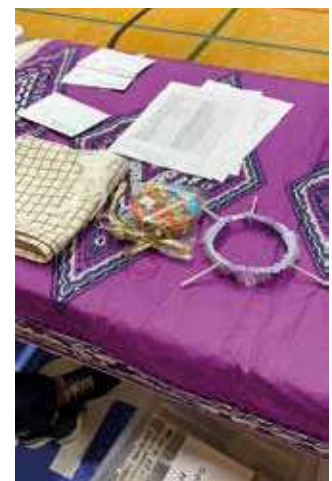
Arvat tekivät hyvin kaupansa, kun joka arpa voitti.