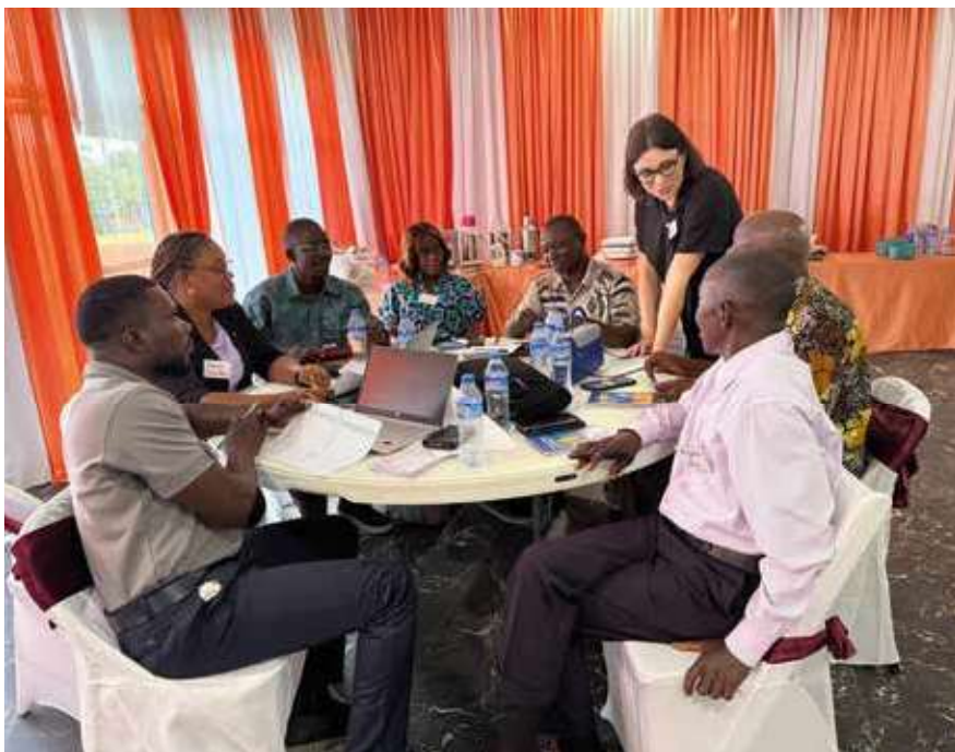
Työpajoissa Liberian opettajankouluttajat laativat opetussuunnitelmien sisältöjä ryhmissä.