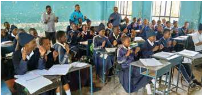
Kuvia hankekouluiltamme Mulalan, Nasholin ja Seelan yläkouluilta lokakuulta 2025.