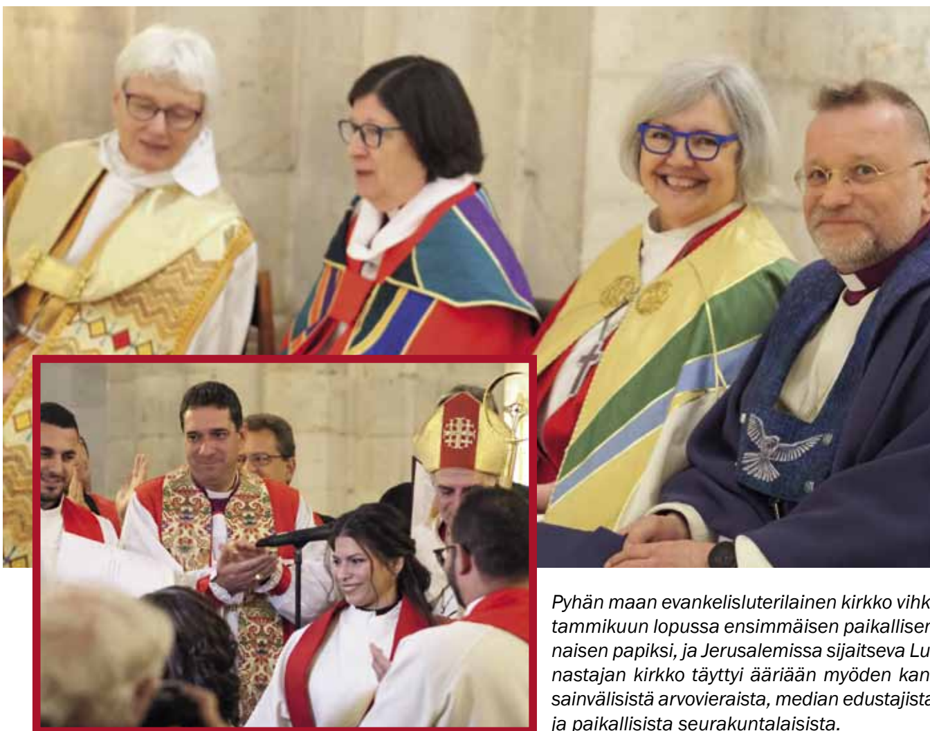
Pyhän maan evankelisluterilainen kirkko vihki tammikuun lopussa ensimmäisen paikallisen naisen papiksi, ja Jerusalemissa sijaitseva Lunnastajan kirkko täyttyi ääriään myöden kansainvälisistä arvovieraista, median edustajista ja paikallisista seurakuntalaisista.