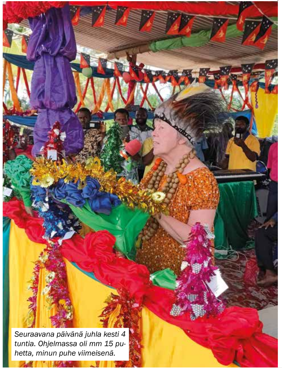
Seuraavana päivänä juhla kesti 4 tuntia. Ohjelmassa oli mm 15 puhetta, minun puhe viimeisenä.