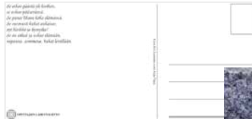
Painetut köynnöskukka- kortit 1 € / kpl (Takana Kaija Piipponen runo)