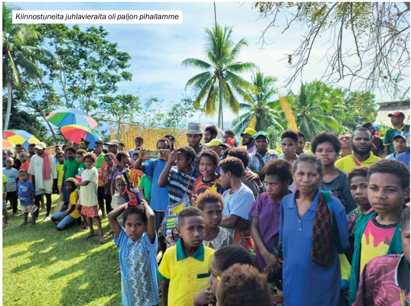
Kiinnostuneita juhluvieraita oli paljon pihallamme