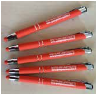
Kynät 2 € / kpl