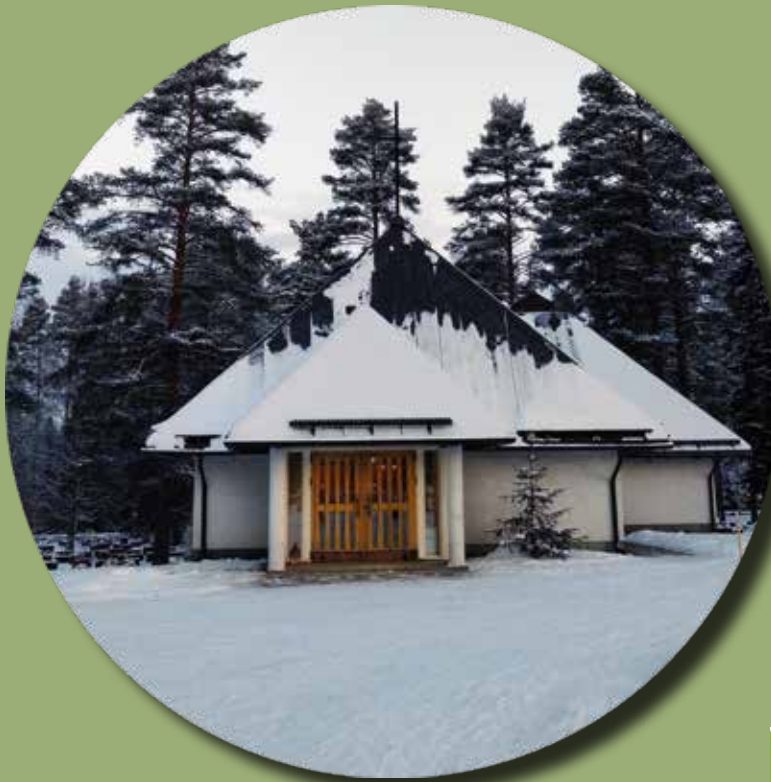
Joroisten kappeli, kuva Anu Ylitolonen.

Opettajien Lähetysliiton hallitus kokoontuu vuosikokouksen jälkeen.