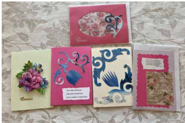
Onnittelukortit 3 € / kpl