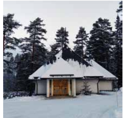
Joroisten kappeli.