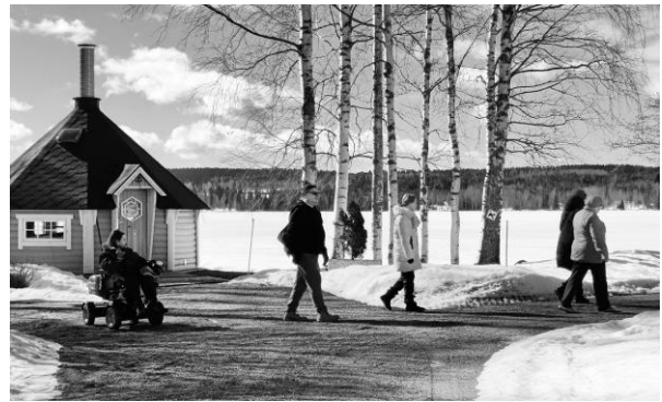
31.3.21 Ulkoilupäivä Rytkyllä.

Invalidiliitto myöntää enintään kaksi avustusta per yhdistys. Avustusta haetaan oman yhdistyksen kautta sosiaalisin ja taloudellisin perustein ja sitä ei myönnetä samalle henkilölle peräkkäisinä vuosina ilman perusteltua syytä. Ilmoittaudu hakijaksi toimistolle 25.10. mennessä.