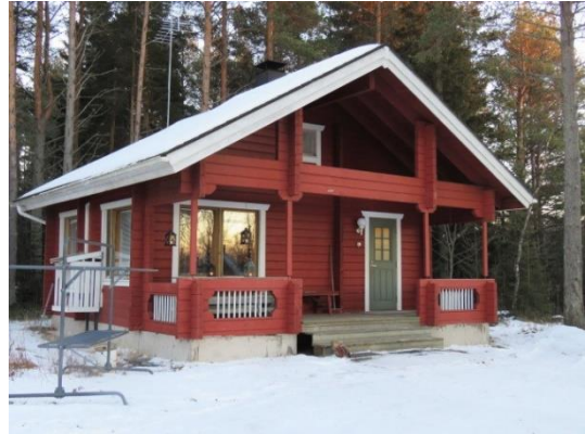
Vipukka Virpiniemessä (6-11 hlölle)