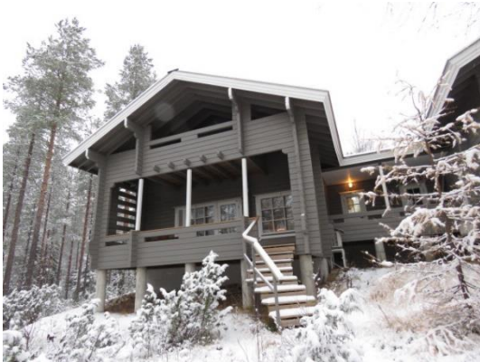
Ukonkieppi B Ukkohallassa (12 hlölle)

Toinen mökki sijaitsee Haukiputaan Virpiniemessä. Meren rannalla sijaitseva mökki on Virpiniemen aktiviteettien vieressä mutta silti suojaisessa paikassa.