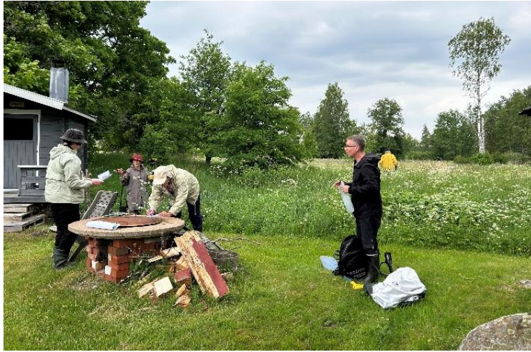
Saunarannassa tarkistettiin löytöjä...(taustalla saunarannan pelto 3).