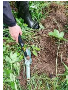
Löytö pointteri ja lapio