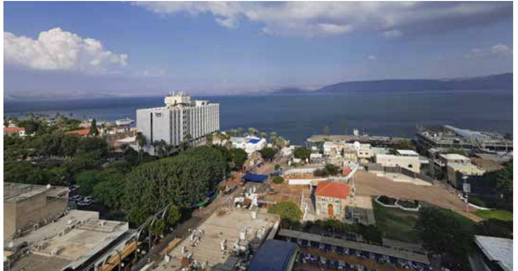
Näkymä Genesaretinjärveltä hotellihuoneen ikkunasta katsottuna.

(Toimittaja Henry Ahon tekemää haastattelutekstiä on muokattu hiukan Eija Rintalan kanssa sen jälkeen, kun se julkaistiin Teuvalla ilmestyvässä paikallislehti TeJuKa:ssa ( https://www.tejuka-lehti.fi/ )).