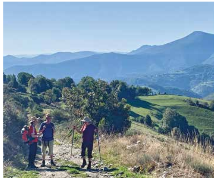
Reitillä oli joitakin pitkiä, ei kuitenkaan jyrkkiä nousuja. Maiset palkitsivat vaeltajan.