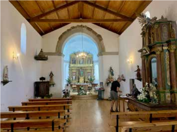
Passin leimaus eräässä kirkossa.