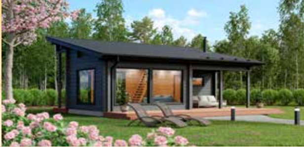
Suvanto 50 saunamökki

Valmistamme mökit asiakkaan toiveiden mukaan, jo 36 vuoden kokemuksella. Katso lähin edustaja: saunat.net