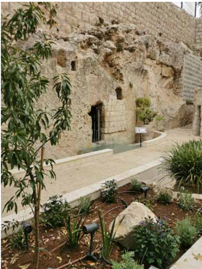
Puutarhahauta, juuri se, johon Jeesus kerrotaan haudatun on kaikkien Israelin toiviomatkalaisten vierailujen ykköskohde.

Evakuointilento lähti matkaan Tel Avivin lentokentältä noin viikko sodan alkamisen