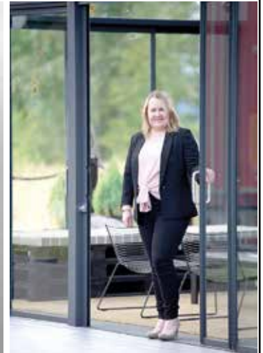
Ovi auki uuteen