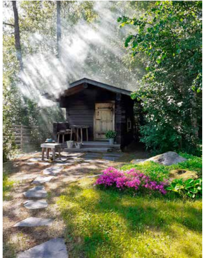
Padasjoen mökillä, savusaunan lauteilla maailman huolet ja työasiat ovat aina jääneet tehokkaasti sivuun.

käyttötavaroiden ostajalle. Sain siis paikan.