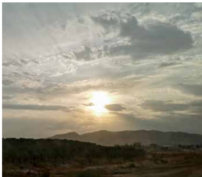
"Pilvimuurista valo välähtää" - Jerikontien varrella olevaa erämaa-aluetta.