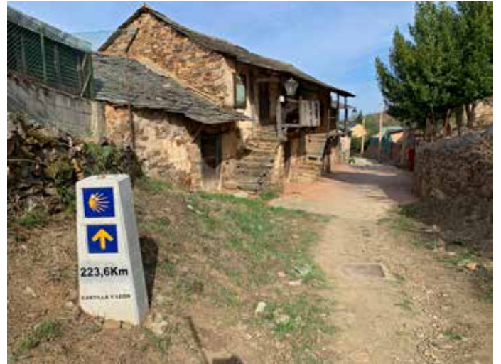
Keltaiset simpukankuvat ja nuolet pitävät kulkijat oikealla reitillä.

tai vastaaviin, joissa oli tarjolla kahden hengen huoneita. Niihin varasimme huoneen puhelimitse aina edellisenä iltana sen jälkeen, kun olimme suunnitelleet seuraavan päivän etappimme. Joka kerran löytyi paikka, mutta joskus tarvitsi useamman soiton. Espanjassa ei puhuta yleisesti englantia, joten soittoja helpottaa, jos omaa jonkun verran espanjan kielen taitoja. Booking.comia voi myös käyttää, mutta kaikki majoituspaikat eivät löydy sieltä.