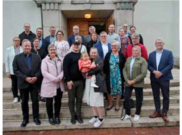
Yrittäjäpäivien päätteeksi melkein kaikki osallistujat ehtivät yhteiskuvaan Ähtärin kirkon pääoville.

Sekä perjantai- että lauantai-iltana kokoonnuimme ensin iltpalalle hotelli Mesikämmeneen, josta sitten siirryttiin aivan hotellin vieressä sijainneelle seurakunnan omistamalle kappelille. Paikka oli meille varattuna molempina iltoina. Sieltä oli