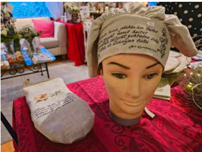
Leipomishuivi ja patakinnas Tepan omilla teksteillä on uniikki lahjaidea.