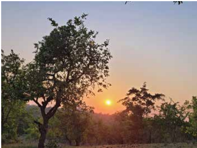
Aamuaurinko tropiikissa Mosambikin puolella Ilkka Rautiaisen kuvaamana.

vät koskaan ole voineet edes unelmoida niin hyvistä ja vahvoista taloista, joissa he saavat nyt asua. Ruoka-apukin on luonut toivoa yli ihmismielen ja yli ongelmien. Lapset ovat päässeet kouluun ja ovat saaneet tulevaisuuden näkymiä omiin elämiinsä.