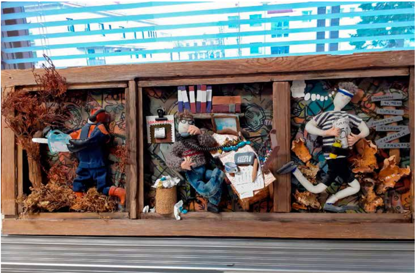
Ystävän tekemä, tikkutäkkitekniikalla tehty taulu kuvaa Raspin monivaiheista työelämää ja harrastuksia.

Teksti: Mailiss Gustafsson