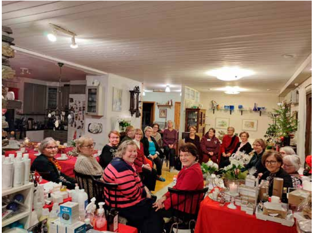
Launeen Marttojen iloinen joukko muutti Kemppaisten kodin sujuvasti näyttelytilaksi.

Oma käyntini osuu joulu-kuun toiseen päivään, ensimmäisen adventin aattoon. Kahden edellisen viikon aikana täällä on käynyt useita eri kokoisia ryhmiä, muun muassa Launeen Marttojen 18 henkilöä. Menoa ja mei-