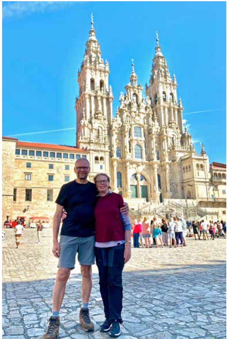
Vihdoin perillä Santiago de Compostelan pääkatedraalin edessä.

Messuja on monta kertaa päivässä, ja ne ovat tupaten täynnä. Jos aikoo saada hyvän paikan – tai paikan ollenkaan – on syytä mennä jo tuntia etukäteen. Messu pidetään espanjaksi. Mutta vaikka ei ymmärtäisi kieltä, kokemuksena on mieliinpainuva. Kohokohta on katoista riippuvan valtavan kokoisen suitsutusastian keinuttaminen kirkkosalin laidalta toiselle. Sen liikkeelle saamiseen tarvitaan usean miehen voima.