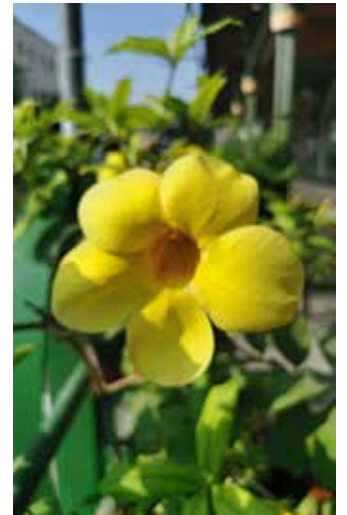
Kukkaloistoa Israelissa loka-kuun toisella viikolla.