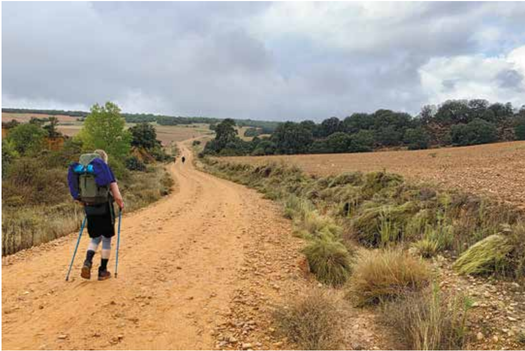
Alkumatkasta oli vielä tasamaata. Jokeloiden päivämatkat olivat noin 20 kilometriä.

Vaellussauvoissa ongelma on, että lentoyhtiö ei välttämättä ota niitä käsimatkatavaroihin. Me ratkaisimme asian niin, että emme ottaneet sauvoja mukaan, vaan ostimme Espanjasta sauvat ja lähtiessä jätimme sinne. Decathlonissa ihan käypä vaellussauva maksaa 6 euroa.