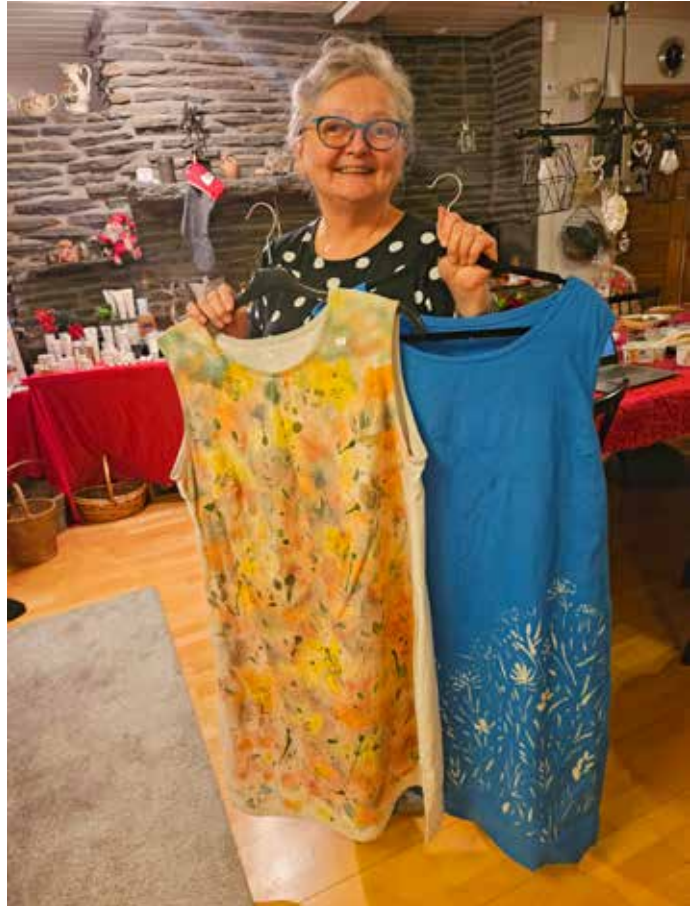
Myös vaatevalikoima on kokonaan Kukinnon kammarin eli Tepan omaa designia.