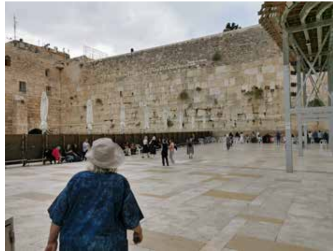
Jerusalemiin vanhasta temppelistä jäljellä oleva seinän osa "Itkumuuri" on kaupungin ikonisin kuvauskohde.