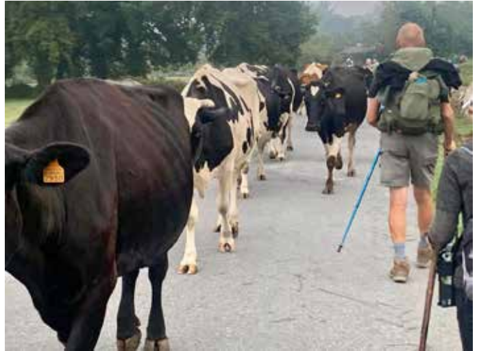
Caliciassa vaellettiin osan matkaa myös lehmien seurassa.