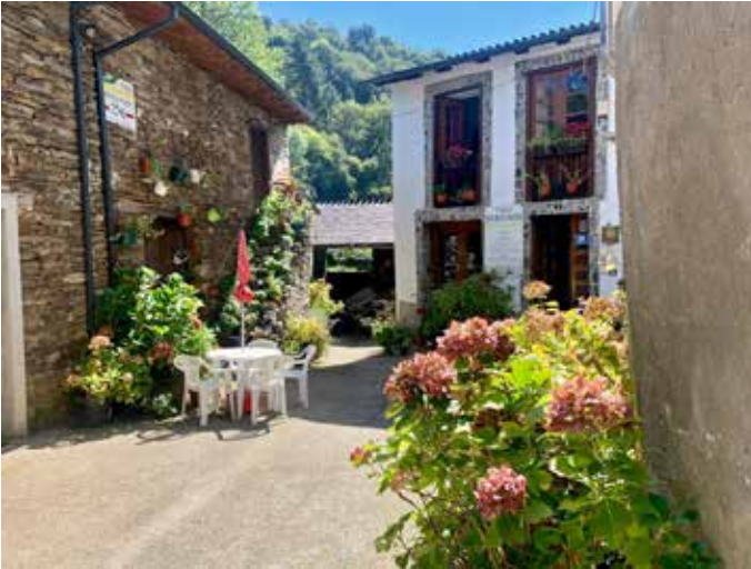
Majapaikka Samosissa ranskalaisen reitin varrella.