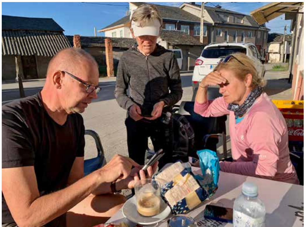
Vaelluspäivinä oli aikaa tavata ja jakaa kokemuksia muiden matkalaisten kanssa.

Lopulta päädyimme majoittumaan hotelleihin, hostelleihin