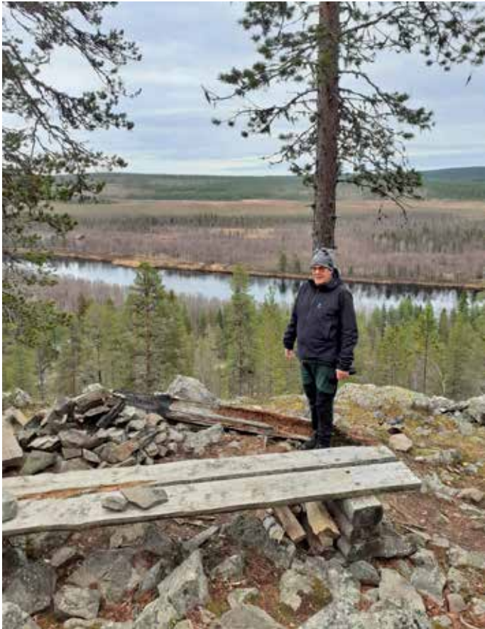
Myös pohjoisin Lappi on vetänyt "Raspia" puoleensa vapaa-aikoina jo vuosikymmenten ajan.