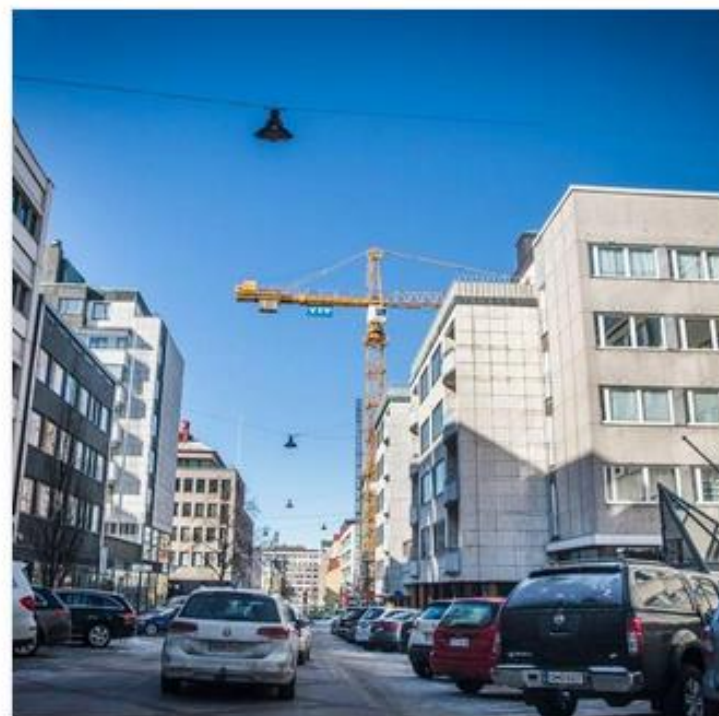
Kysely: Päijät-Hämeen ikäihmiset haluaisivat