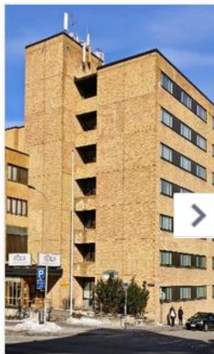
Kysely: Päijät-Hämeen ikäihm