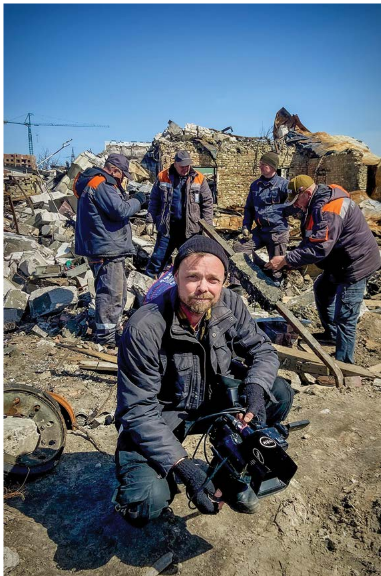
Bucha, huhtikuu 2022. Taustalla kaasulaitoksen työntekijät etsivät kaasuputkia raunioista.