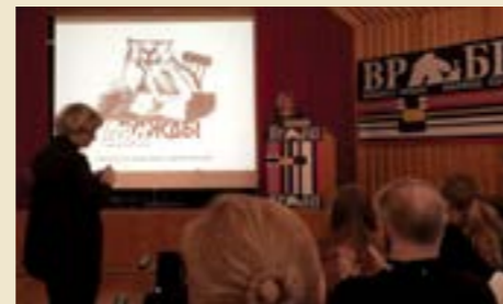
Kokoukset ovat hyvin keskustelevia. Sananvapaus on niiden kestoaiheita. Tässä puheenvuoroa käyttää muurmanskilaislähtöinen Rossia 24:n toimittaja Natalya Solovyova Moskovasta.