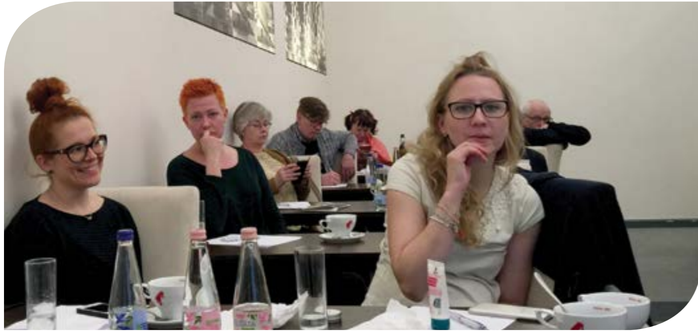
MOT:n jäsenmatkalla Riiassa pohdittiin mm.miten kilpailukyky sopimus vaikuttaa MOT:n jäseniin. Matkalle osallistui parikymmentä jäsentä.