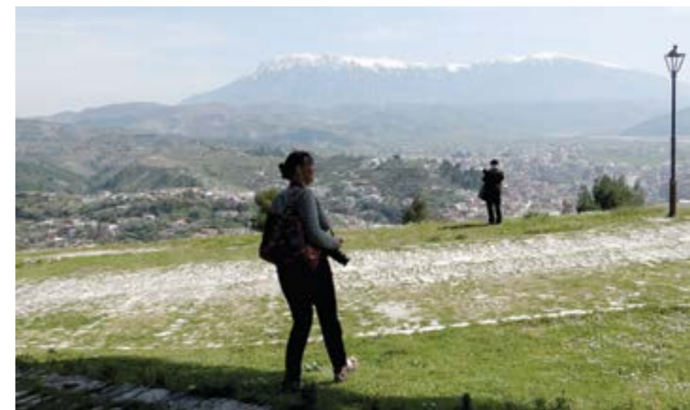
Beratin linnoitukselta aukeaa maisema vuoristoon.

Matkamme jatkui Tiranasta Frujëen, Elbasaniin, Beratiin ja Dürresiin. Näimme huikaisevan komeita maisemia ja monia muistomerkkejä Albanian hamaan muinaisuuden ulottuvasta historiasta. Matkan varrella näkyi aikoinaan rakennuttamia bunkkereita. Ruoka oli hyvää, ihmiset ystävällisiä ja viini maistuvaa, eikä rakissa ja kansallissankari Skanderbegin mukaan nimetyssä brändissäkään ollut valittamista. Hyvä reissu, vaikka jalkaparat joutuivatkin välillä aikamoiselle koetukselle. •