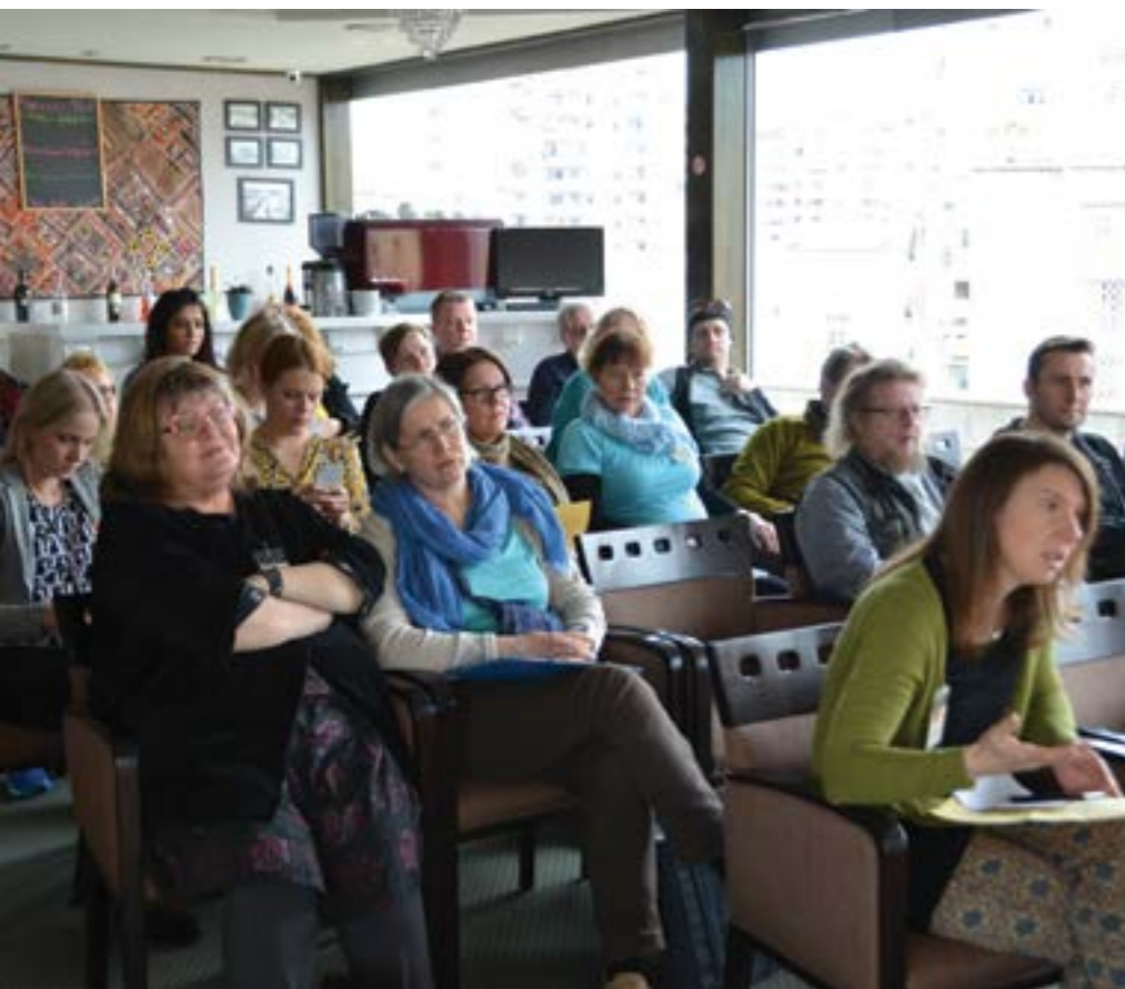
FAO:n matkalaiset saivat rautaisannoksen tietoa Albanian mediakentän kuulumisista.

kirjoittaa kolumneja demokraattista puoluetta kannattavalle oppositiolehdelle salanimellä, koska ei halua itsensä ja perheensä joutuvan vaikeuksiin.