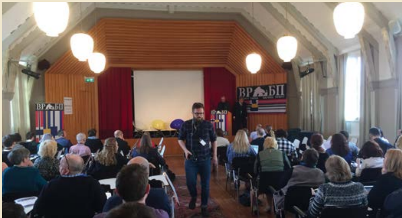
Barents Press Internationalin vuosikokous järjestetään vuorotellen Norjassa, Ruotsissa, Suomessa ja Venäjällä. Tänä vuonna oli vuorossa Ruotsi ja Haaparanta.