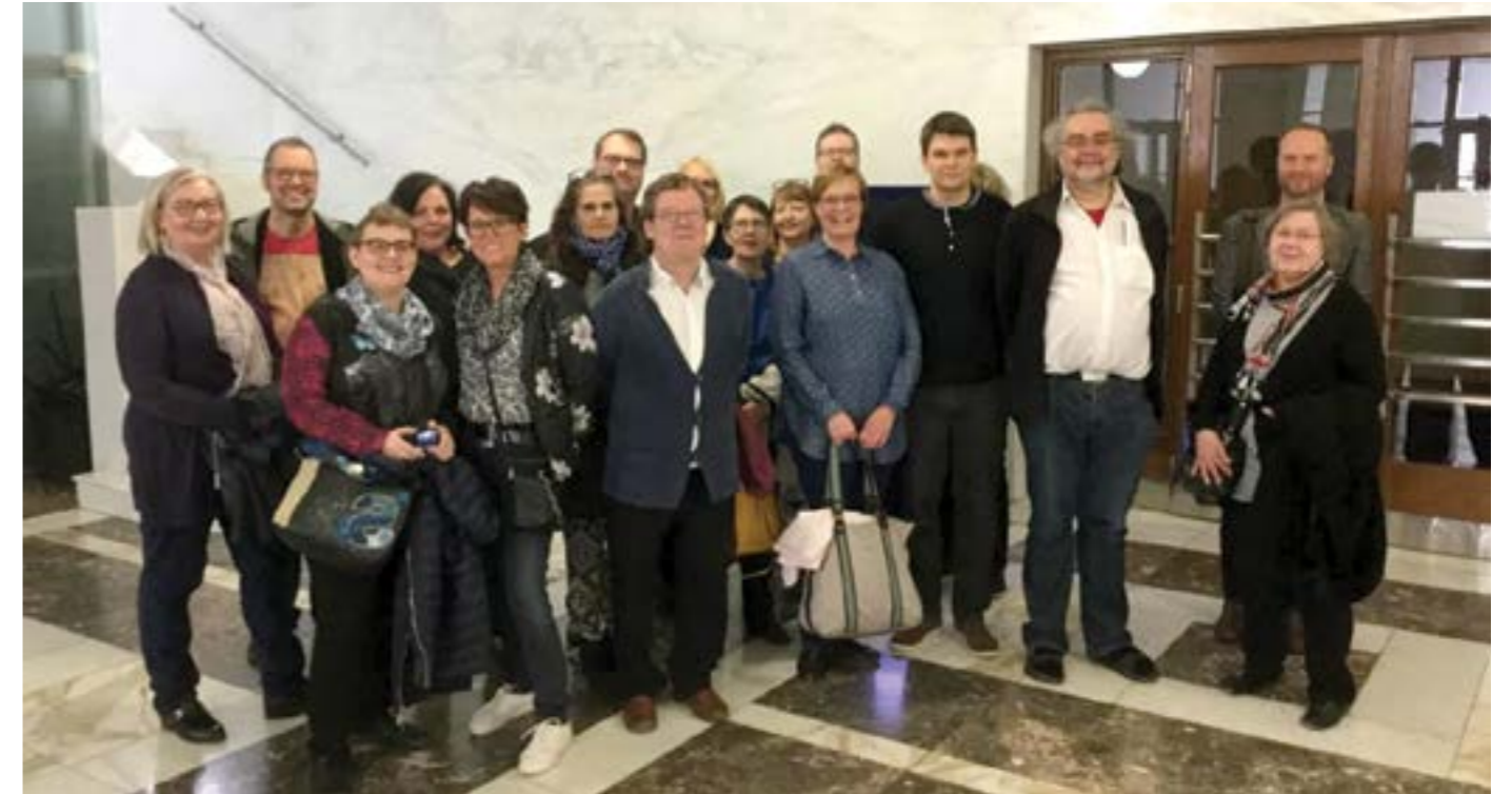
Kuva ja teksti Leena Korsumäki

Prahan kevät ei ollut kuumimmillaan eikä kuivimmillaan, kun YOT:n Pasilan osaston 43-henkinen matkaryhmä vieraili kaupungissa 15.-18.4.