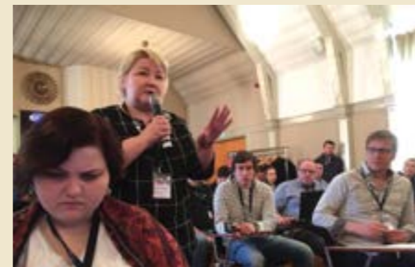
Haaparannan kokous lähetettiin netissä suorana ja sen parhaat palat ovat edelleen katsottavissa järjestön nettisivuilta.