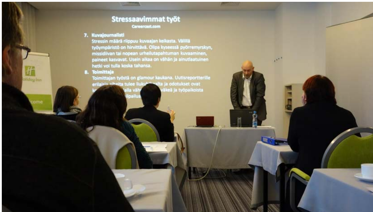
RTTL:n hallituksevaihtoseminaarissa puhuttiin mm. työstressistä.