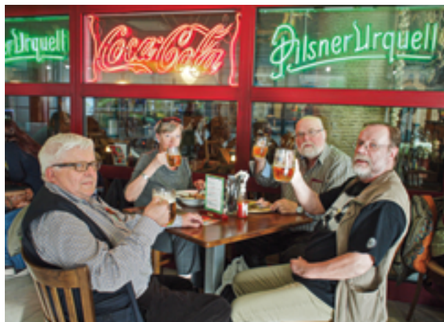
Prahan makuja vuonna 2013.