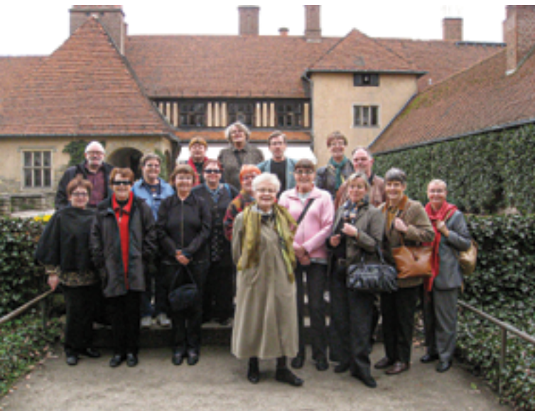
Kuvassa Berliinin matkalaisia vuonna 2008.

- Oveluutta logossa ilmentää minusta tuo ketun selän taakse laitettu mikrofoni. Se myös kertoo ajatuksen ”työura takana – tulevaisuus edessä”. Logo oli pitkään käytössä ja se oli minusta oikeinkin kuvaava. Nyt on toisenkinlainen logo olemassa.