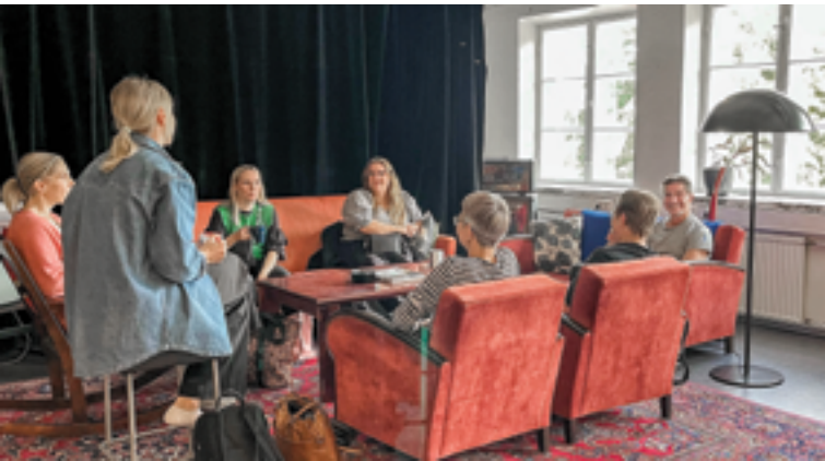
Audiokäsikirjoittamisen osallistujia Artlabin tiloissa syyskuussa 2023.