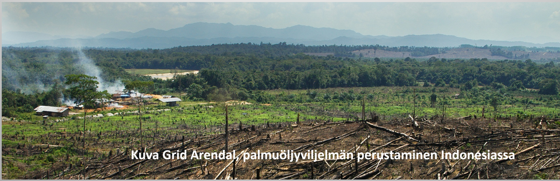
palmuöljyviljelmän perustaminen Indonesiassa