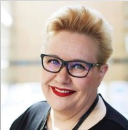
Kuva: Sirpa Pietikäinen