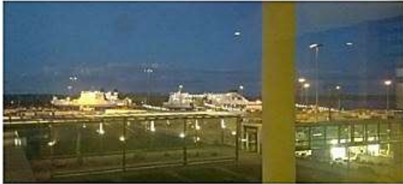
Kotia kohti Trawemündestä.