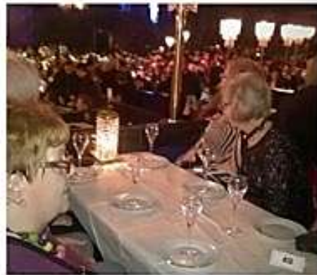
Ja sitten Ibis Tour Eiffel Cambronne hotelliin nukkumaan.