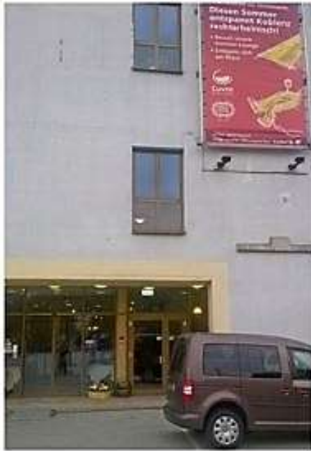
Diehl's Hotel Koblenzissa Rheinin varrella. Vieressä oli joen lisäksi Lidlin myymälä ja junarata.