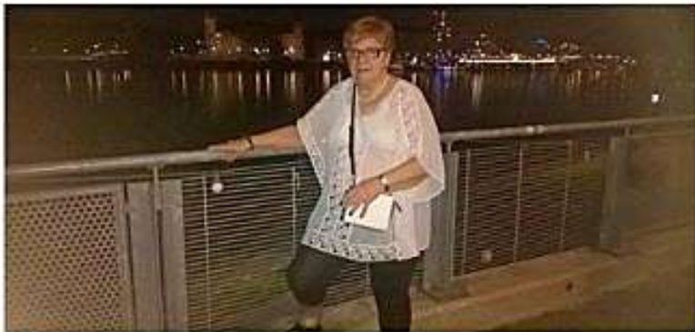
Rhein ja Diehl's hotelli by Night.