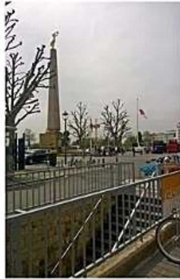
Avattiin tili Luxemburgissa Die Goldene Frau'n katveessa.