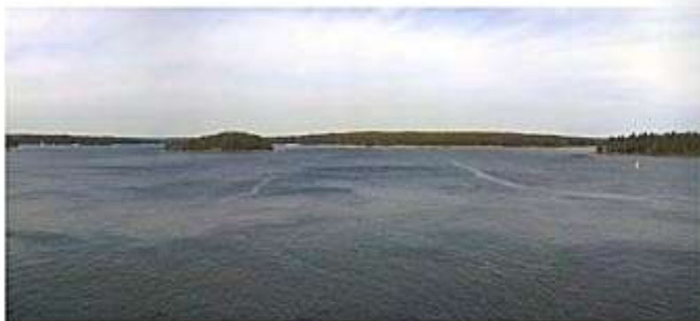
Suomi on paras maa suomalaisille . . .