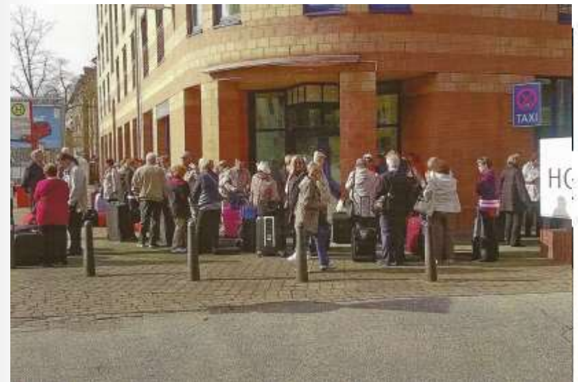
Illastimme ja yövyimme Hampurin Ramada Hotel Bergedorfissa. Aamulla varhain menoksi Bremeniä kohti.