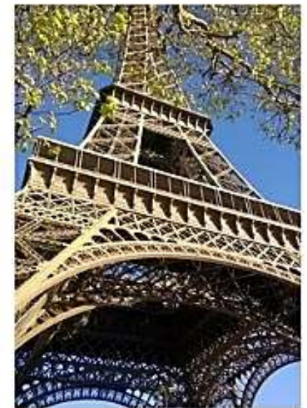
Seuraavana aamuna pirteänä herra Eiffelin tornia ihmettelemään.