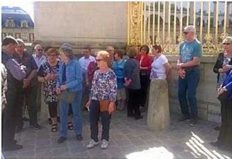
Ennen Versaillesin reissua ja Aurinkokuningas Ludwig XIV:n aarteiden katselua vähän tankkaillaan.