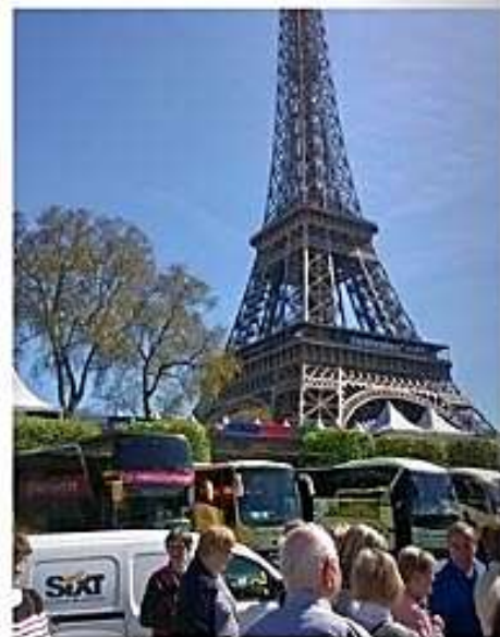
Prinsessa Dianan muistomerkkin ja Pariisin kattopuutarhojen kautta Seinen risteilylle.