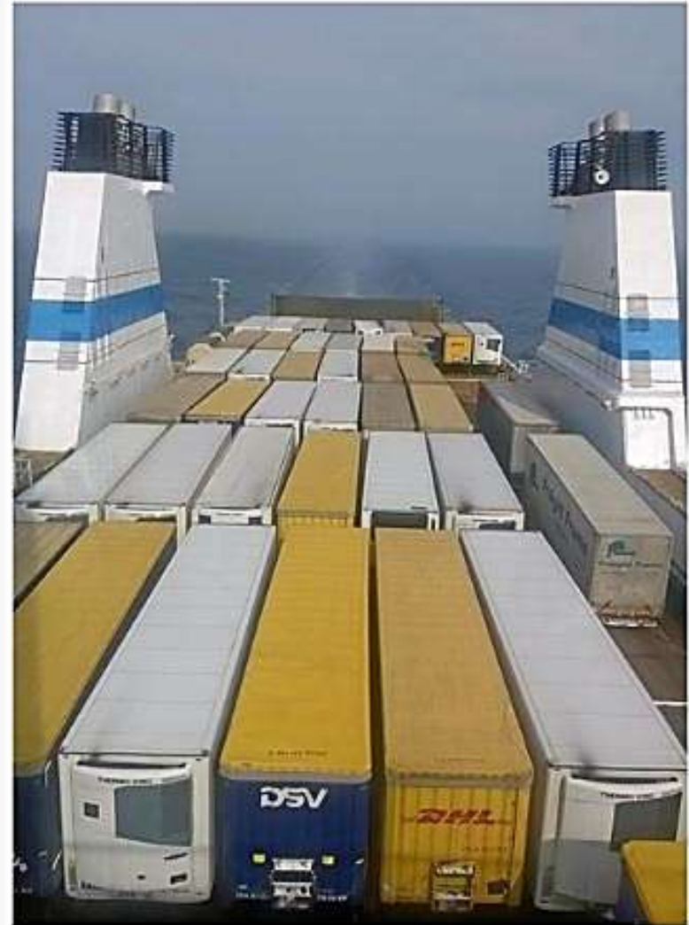
Finnmaid'illa mentiin ja Finnlady'llä tultiin - konttien kanssa. Ruoka oli hyvää ja juomatkin maistuivat.