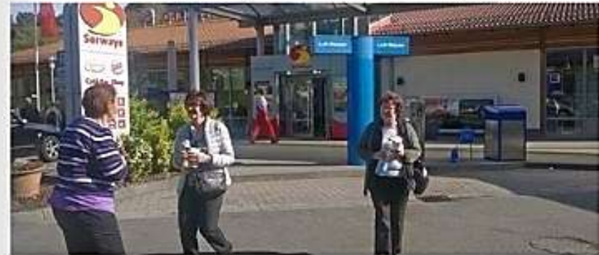
Matkalla Koblenzista Trawemünde (620 km) tankkailtiin.