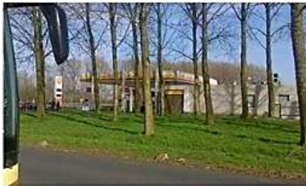
- pidettiin taukoa