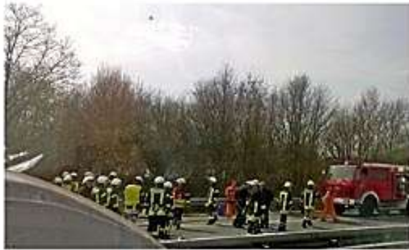
Matkalla Amsterdamiin: - pienlentokone putosi