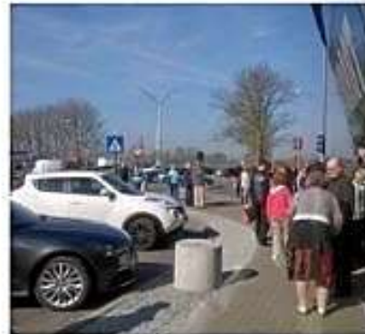
Ruuhkassa kohti Pariisia välillä pysähdellen, tietulleja maksellen ja sitten . . .