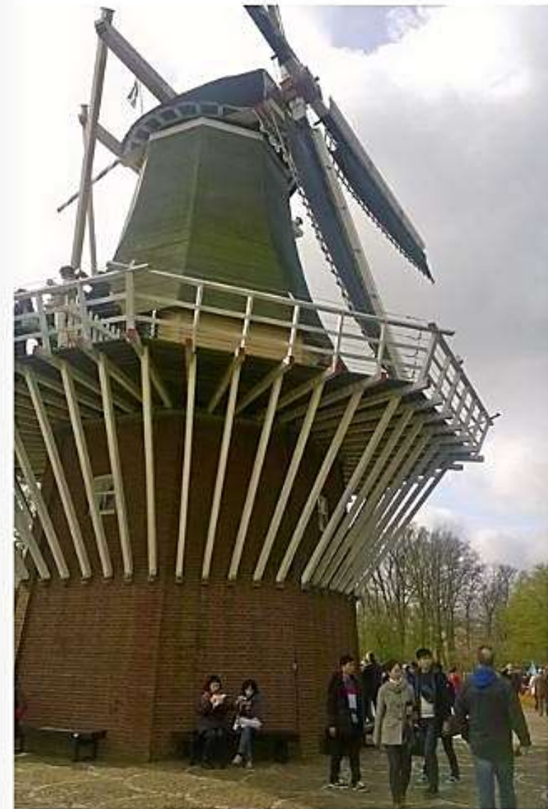
Illoisen Amsterdamin retki jatkuu . . .