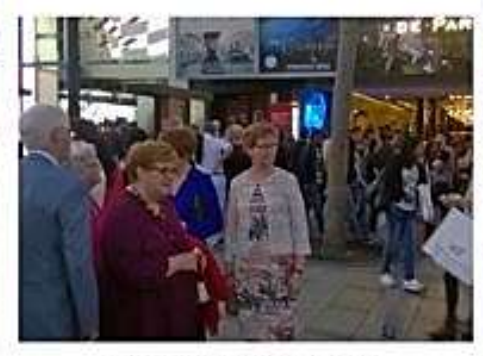
Illalla Lidoon - tottakai.