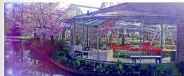
Keukenhofin tulppaanipuiston loistoa.