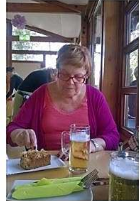
Bremenin Alppiruusupuistossa oli kevät alullaan. Leivos ja olutkin maistuivat.