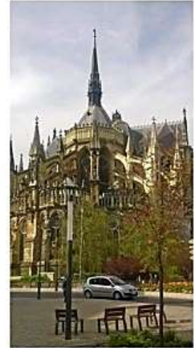
Kaffilla Reimsin Notre Damen vieressä matkalla Koblenziin.