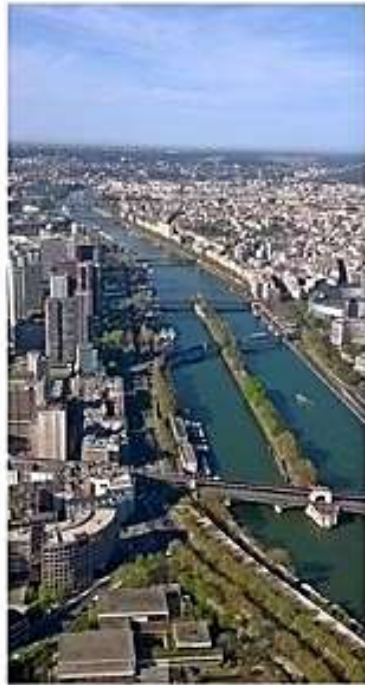
Pariisi on kaunis kaupunki niin Eiffeltornista kuin kiertoajelulla katsellen.