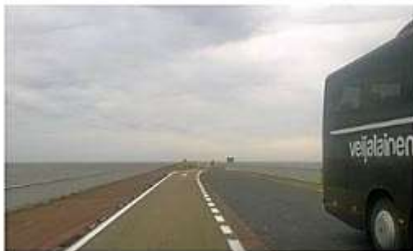
ja ajettiin Alankomaissa pitkin Afsluitdijk'iä