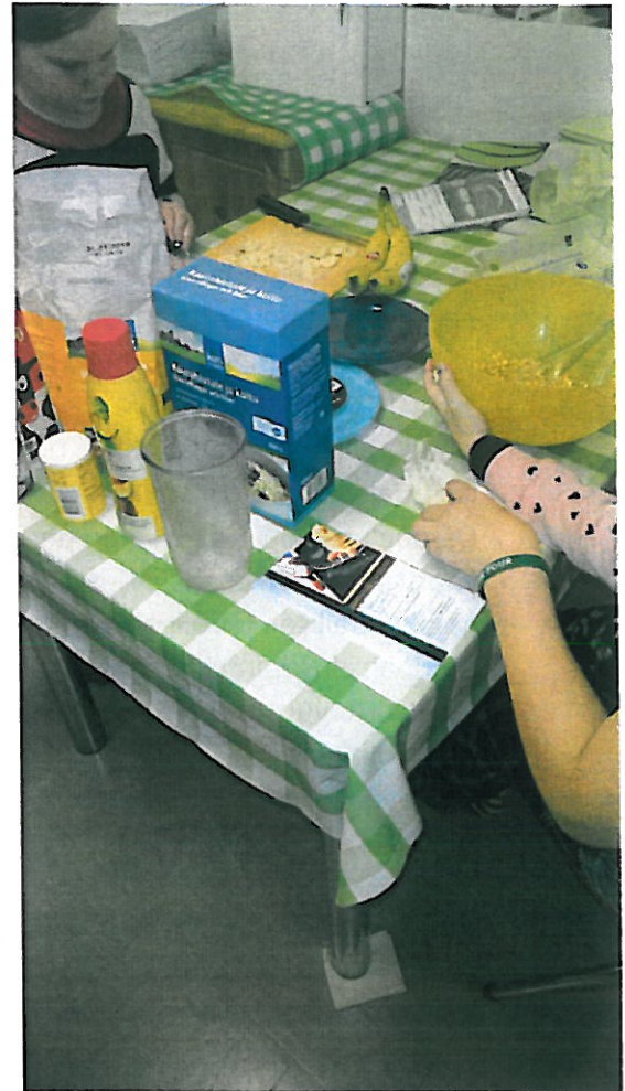
Kerholaiset tekevät itse