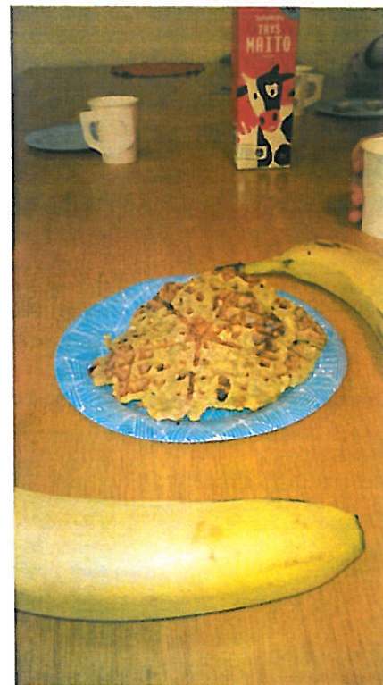
Vohvelit ehtivät aina valmiiksi kerhoillassa