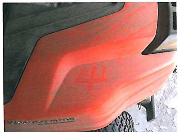
Kuiva kesä 2018 kunnan viheralueilla Siikaisissa