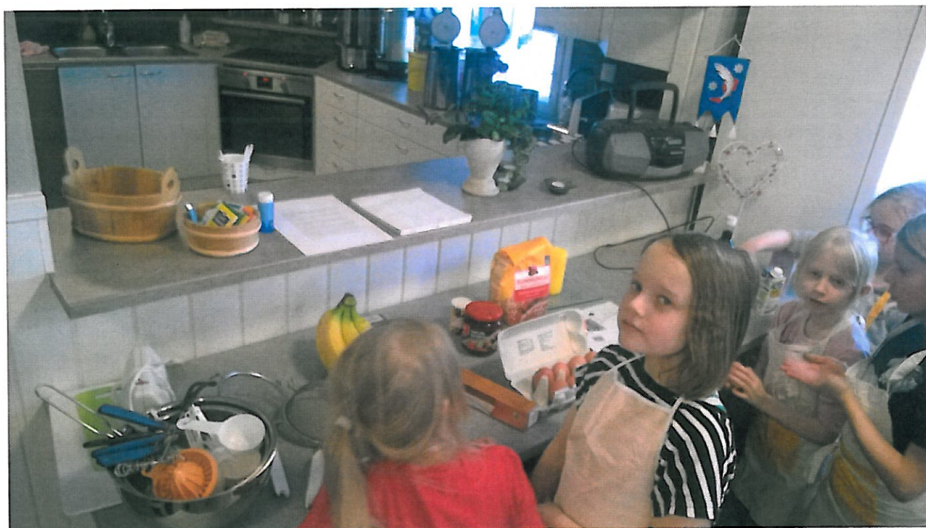
Innokkaita leipureita Sammin 4H-kerhossa