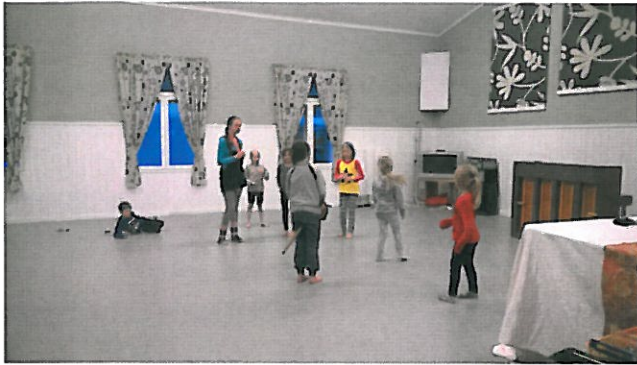
Kerhonojhaaja ja kerholaiset Sammissa