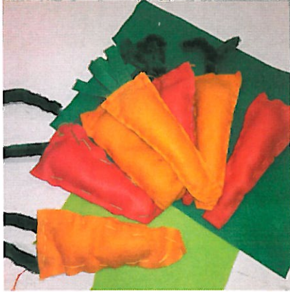
Pehmeitä porkkanoita Sammissa

Sammin ja Pomarkun 4H-kerhot osallistuivat molemmat 4H-liiton juhluvuoden kädentaidon kilpailuun. Kilpailutyöt lähetettiin 4H-liittoon, jossa valitut parhaat työt pääsivät näyttelyosastolle Tampereen kädentaidon messuille marraskuussa. Kerholaiset tekivät mm. upeita porkkanoita, tottakai, 4H-järjestön ”porkkanankasvatusjärjestön” juurien mukaan.