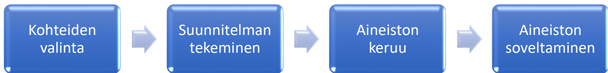
Kuvio 4. Benchmarking-prosessini etenemisvaiheet.

2015, 186.) Päädyin toteuttamaan tämän opinnäytetyön benchmarkingin ilman kontaktia toimijaan, sillä kiinnostukseni kohteena olevat materiaalit olivat vapaasti saatavilla internetissä, enkä uskonut vierailujen tai haastattelujen tuovan tutkimukseen enempää lisäarvoa. Suoritin benchmarkingin huhtikuussa 2022 alla olevan kuvion (kuvio 4) esittämien vaiheiden mukaisesti.