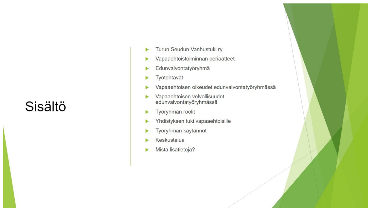
Kuva 1. Perehdyttäjän PowerPoint-diasarjan sisältödiä.

Kehittämistyöni tuotoksena kokosin perehdyttäjän diasarjan sekä vapaaehtoisen muistilistan. Halusin saada perehdyttäjän diasarjan sisältämän tiedon mahtumaan noin kymmenen dian sisälle, jotta se pysyisi mahdollisimman tiiviinä ja keveänä. Lopulliseen tuotokseen tuli 13 diaa, joista yksi on otsikkodia ja yksi sisältödia (kuva 1). On mahdollista, että ryhmän vastuuhenkilö eli perehdyttäjä vaihtuu aika ajoin, joten myös tästä syystä perehdyttäjän diasarja tuli pitää mahdollisimman suoraviivaisena ja helposti ymmärrettävänä.