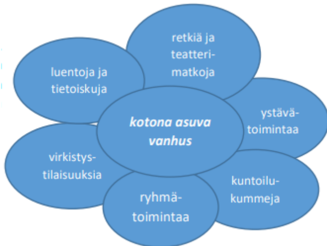
Kuvio 1. Toimintamuodot (Turun Seudun Vanhustuki ry 2021, 4.)

Turun Seudun Vanhustuki ry on turkulainen, poliittisesti sekä uskonnollisesti sitoutumaton yhdistys. Yhdistyksen perustava kokous pidettiin Turussa vuonna 2002, ja vuonna 2003 Patentti- ja rekisterihallitus hyväksyi yhdistyksen merkittäväksi yhdistysrekisteriin. Toiminnan päämääränä on arvokkaan vanhenemisen turvaaminen, johon pyritään pääsemään vanhusten asioiden edunvalvonnalla ja vanhusten hyvinvoinnin edistämisellä. (Turun Seudun Vanhustuki ry 2021, 3–4.) Kaiken toiminnan keskiössä ovat kotona asuvat vanhukset ja heille yhdistys järjestää matalan kynnyksen toimintaa erilaisten tilaisuuksien, tapahtumien, luentojen, avoimen ja suljetun ryhmätoiminnan sekä kuntoilukummi- ja tukiystävätoiminnan muotoin (kuvio 1).