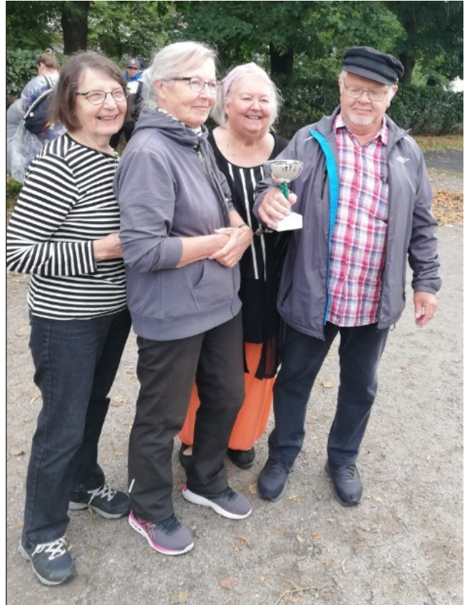
Mөлккүturnauksen 2023 voittajajoukkue