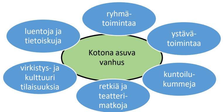
Kuva 1. Vanhuksille suunnattu toiminta yhdistyksessämme.

Järjestämme vanhuksia kiinnostavaa ja heidän elämäänsä koskettavaa kaikille avointa ja pääosin maksutonta toimintaa. Tilaisuudet toteutetaan liikuntaesteettömissä tiloissa. Mikäli STEA myöntää rahoituksen, jatkamme Ak-rahotteista Tukiystävätoimintaa sekä STEAn tuella Kuntoilukummitoimintaa.