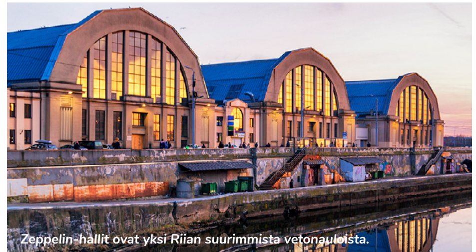
Zeppelin-hallit ovat yksi Riian suurimmista vetonauloista.

Paluu Pärnuun ja päivän lopuksi omatoimista ohjelmaa