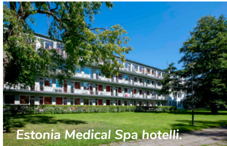
Estonia Medical Spa hotelli.