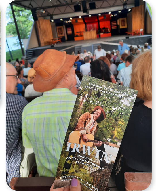
Olimme katsomassa Irwin-musikaalia Valkeakoskella Apianniemen kesäteatterissa 20.6.2023.

Mitä tuli tehtyä? No tulihan sitä vaikka mitä. Tässä muutamia kuvia kesän tapahtumista, joita yhdistys järjesti jäsenilleen.