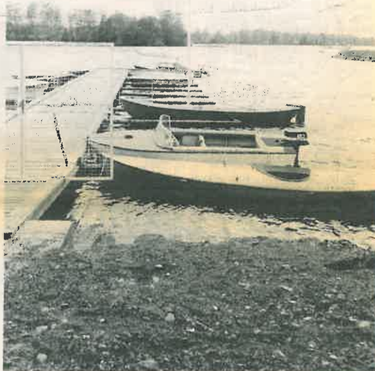
Veneen talviteloille nostoa ei pitäisi viivyttää kovin pitkälle syksyyn.

neellä ei hoito pääty siihen. Tunollinen veneilijä käy paattinsa luona säännöllisesti tarkistamassa aluksensa tilan. Samalla voi mainiosti suunnitella tulevan kesän kunnostusurakkaa. Aina kevät tulee veneilijälle yllätyksenä ja aina hänellä on keväällä kiire.