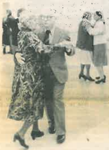
Kunnantalon ala-salissa pyörähdeltiin oikein vanhan hyvän ajan tyyliin.

Konsertin kuuntelijalla vältyi laulajien innostus ja laulamisen riemu, laulajien iästä riippumatta. Toivoisi vain enemmän esityksiä julkisuuteen.