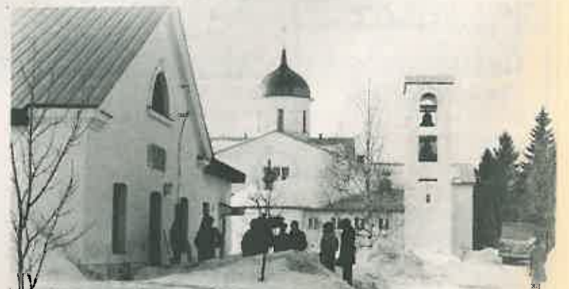
Pirkkalan seurakunta järjestää marraskuussa retken Heinävedelle uuden Valamon luostariin. Retki on tarkoitettu kaikenikäisille pirkkalalaisille. Kuvassa ruokailualue ja Kristuksen kirkastumisen kirkastumisen kirkko luostarialueella.