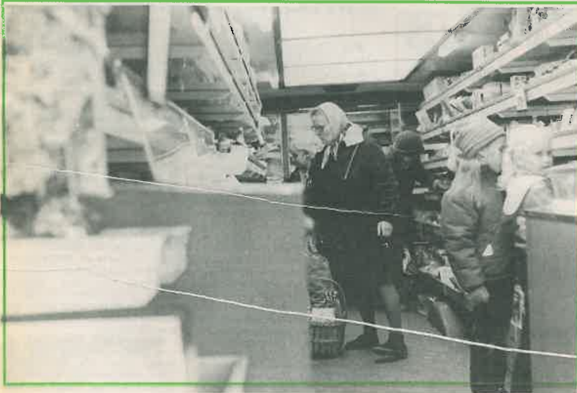
Auto viipyy joka pysäkillä sen aikaa, että kaikki ehtivät tehdä ostoksensa rauhassa.