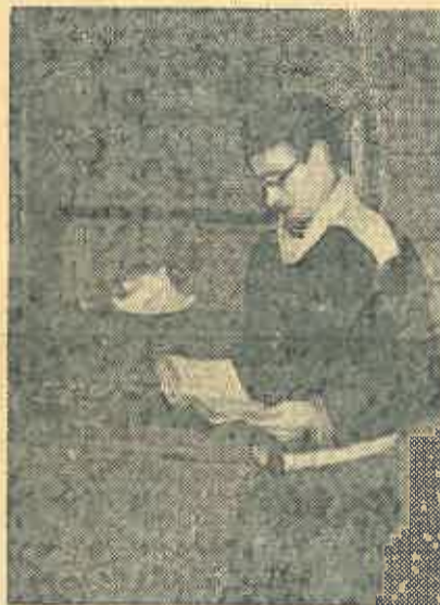
tamme asukasta, joka on kiinnostunut kotiseututyöstä.