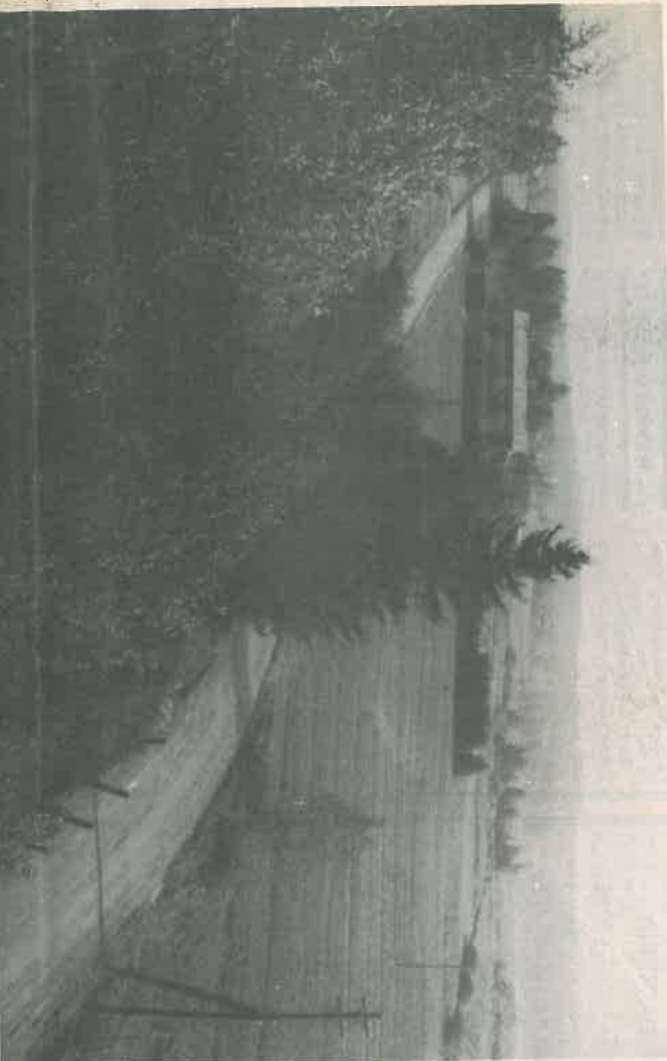
Näin muuttu maisema. Muutama vuosikymmen sitten nykyinen kuntakeskus oli Ratsutilantietä katsottuna pelkkää maalaisidylliä. Peltoaukeaman takana siintää Vähäjärvi.

Naistenmatkan Ollila mainitaan jo Vanhan Pirkkalan historiassa. Talolla oli omat erämaat 1500-luvulla Virtain Vaskivedellä. 1600-luvun ajan Ollila oli ratsutilana.