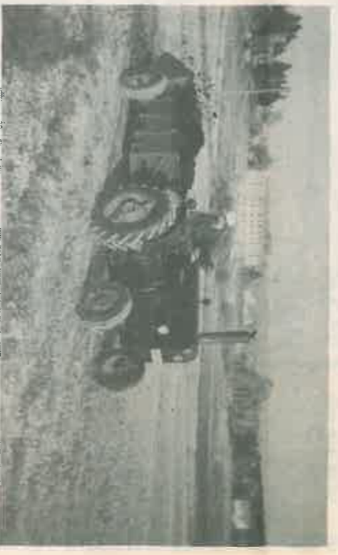
Issepurkava peräkärry oli valokuvauksen arvolinen, sillä se edusti aikansa huipputeknologiat. Tausstalla näkyvät virkailijatalo ja Suupan tilan päärakennus, joka palveli kunnantointistona vuoteen 1964.

Tarkka ja yksityiskohtainen kirjanpito antaa ainutlaatuisia tietoja sekä tilan että yksityistalouden vaiheista. Vuonna 1916 kirjatut tunnit määrät kerto-