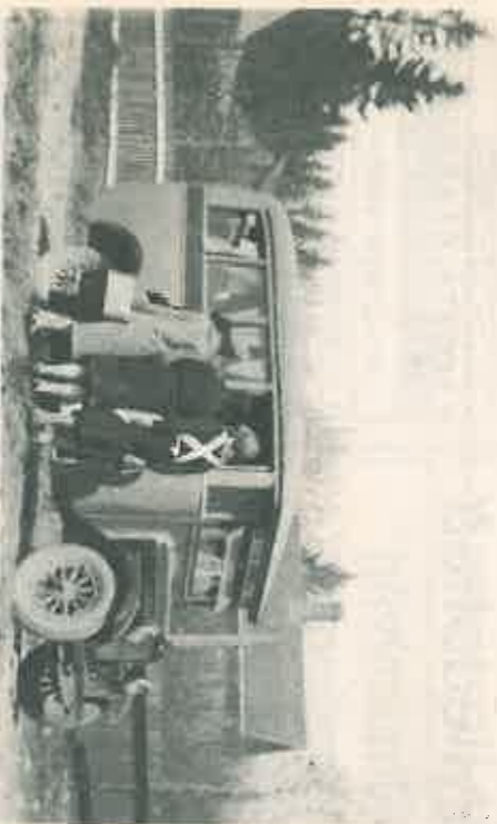
Ensimmäiset linja-autot kuljivat Pirkkalan ja Tampereen väliä harvakseltaan. Tien kuntoskaan ei nähtä hääviltä.

mittari näytti yhtä lämpöastetta, sää oli kirkas ja tuuli kävi etelästä.