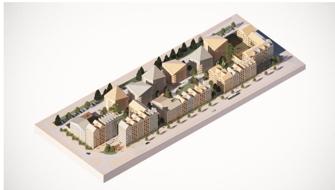
Havainnollistava esimerkkiratkaisu Rykmentinpuiston ikäystävällisestä asuinkorttelista.