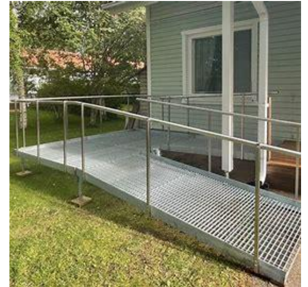
Kuva HP-teko Oy