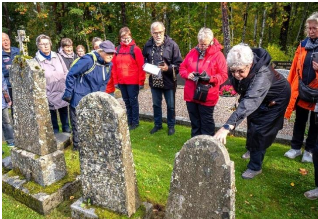
Mielenkiintoisia hautapaikkoja ja tarinoita Hml:ssa 26.9.2024.