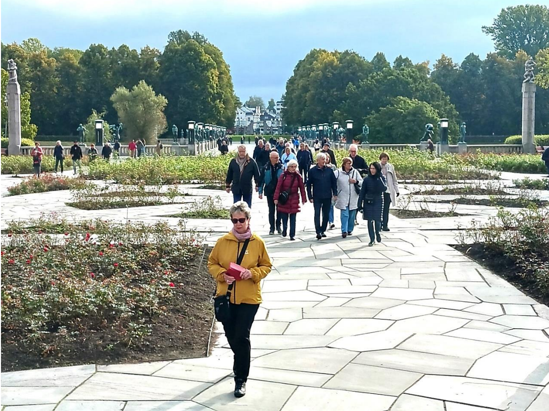
Vigelandin veistospuisto, Oslo, Norja.