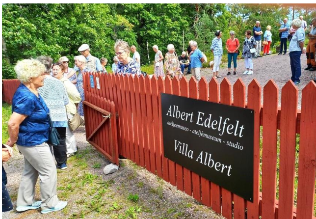
Porvoon retki 24.7.2024.