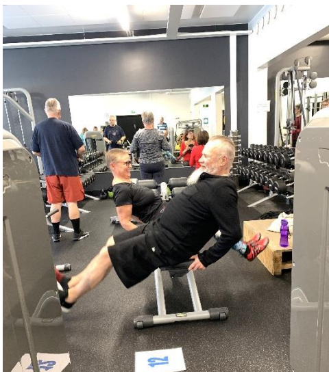
Ohjattua kuntosaliharjoittelua Loimua Areenalla.