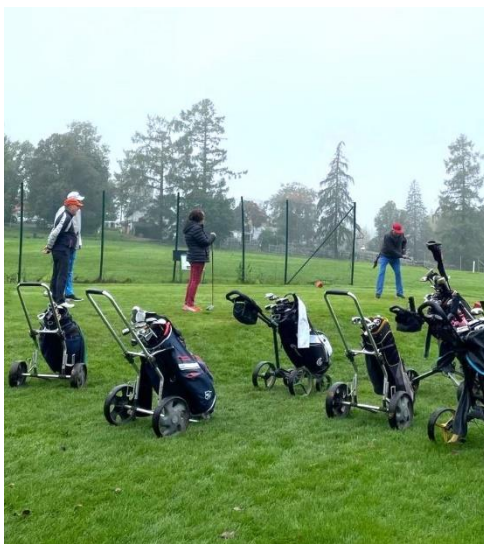
Golf-kauden 2024 päätös Lepaalla.