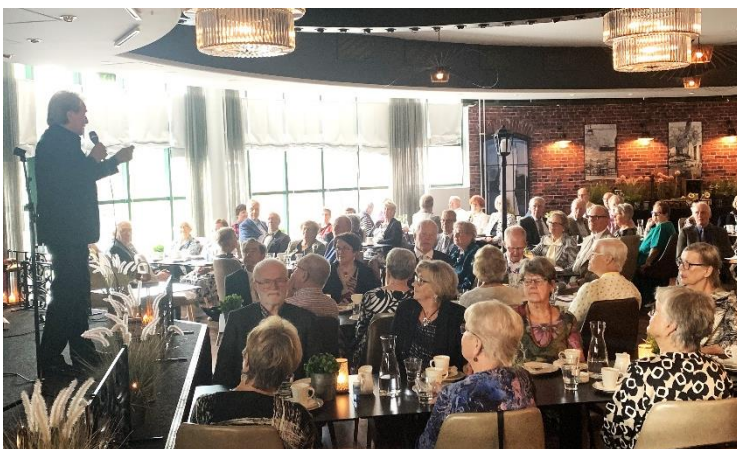
Syntymäpäiväjuhlat 12.9.2024, Hotelli Vaakuna.