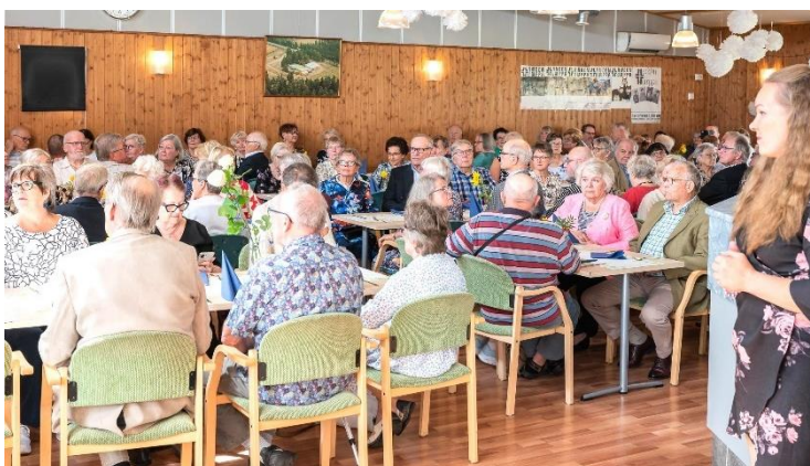
Syyskauden avajaiset Tuuloksen Kapakanmäellä 28.8.2024.