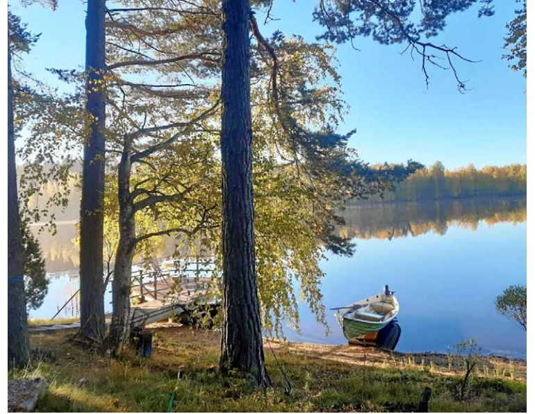
Juvalainen Jukka Kietäväinen kuvasi kotimaisia aivan syyskuun alkupäivinä.