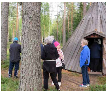
Juvan senioriyhdistys teki tutustumisretken Juva Campingille.

kevyitä kilpailuja, joiden parissa aikaa vierähti reilut puoli tuntia. Sen jälkeen oli vuorossa hiilok-