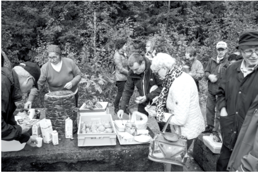
Salpalinja -ulkoilupäivä 13.9.2017 "SenioriSotku" luonnon helmassa. Voileipiä, munkkeja ja kahvia tarjolla armeijan malliin.