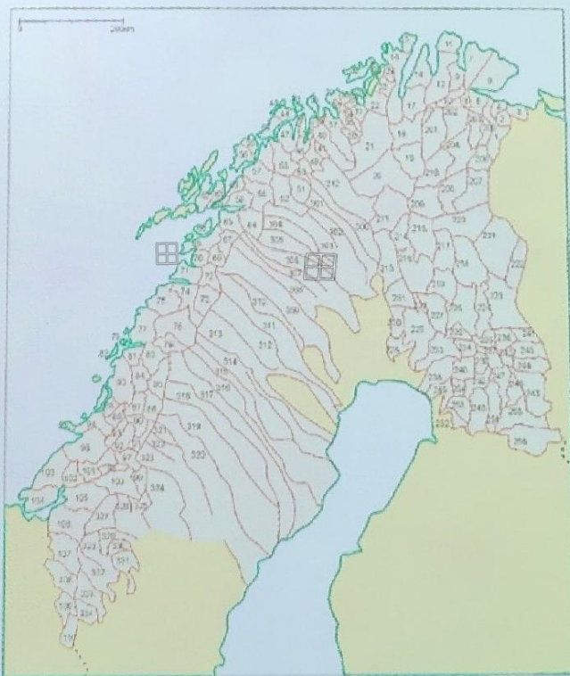
Reindeer Herding, Territorial system map (Fin Swe Nor)