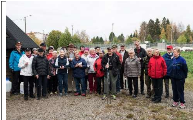
Liikuntabingo Konnarin kentällä ja lähimaastossa lokakuussa.

Hyvää on ollut se, että ulkoilua on ollut entistä enemmän. Ryhmäverryttelyt ja pienimuotoiset kenttäpelikisat ovat virkistäneet harmaata syksyä.