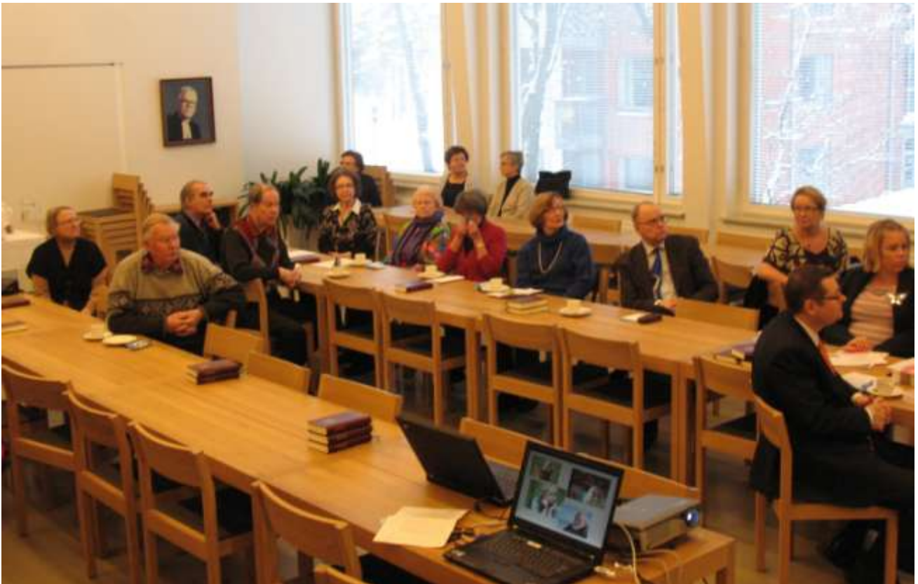
Yhdistyksen ensimmäinen kuukausikokous tammikuussa 2011