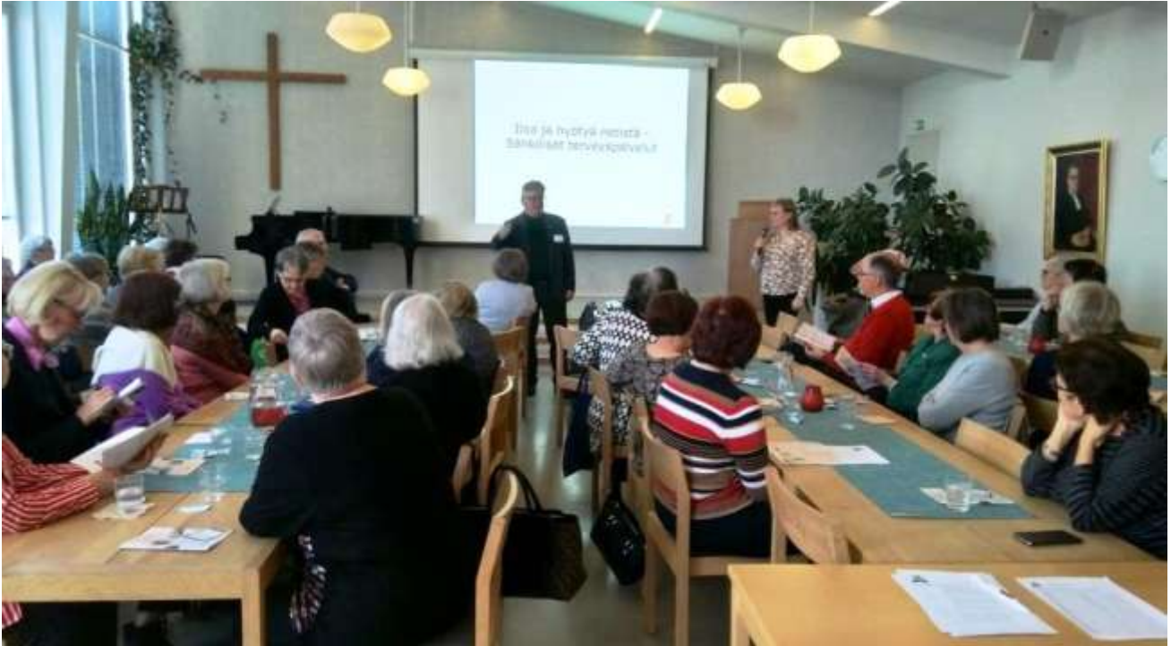
Kuukausikokous tammikuussa 2020. Vuoden 2020 lopussa jäsenmäärämme oli jo 80.