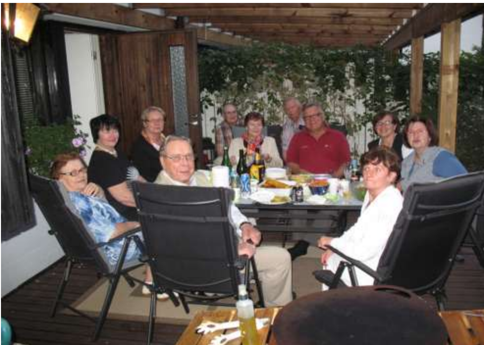
Hallituksen kevätkokous 2014 Niemisten alapihalla