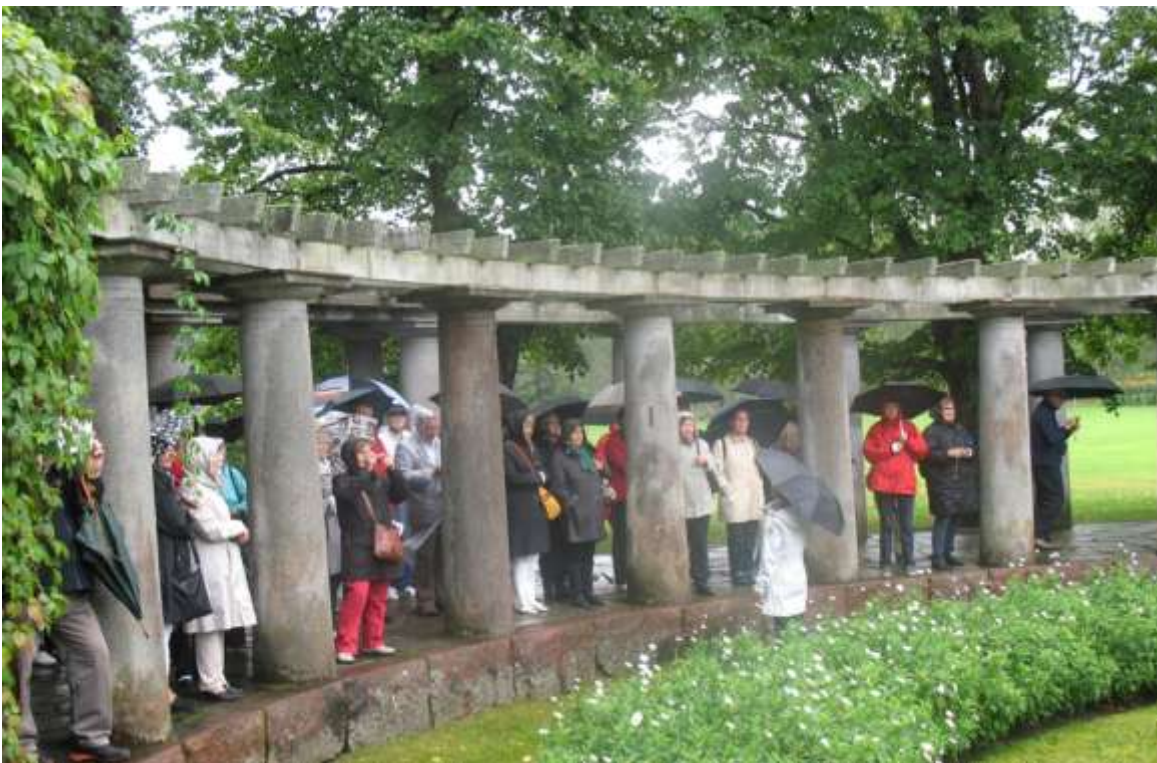
Kultarantaan tutustumassa 2014