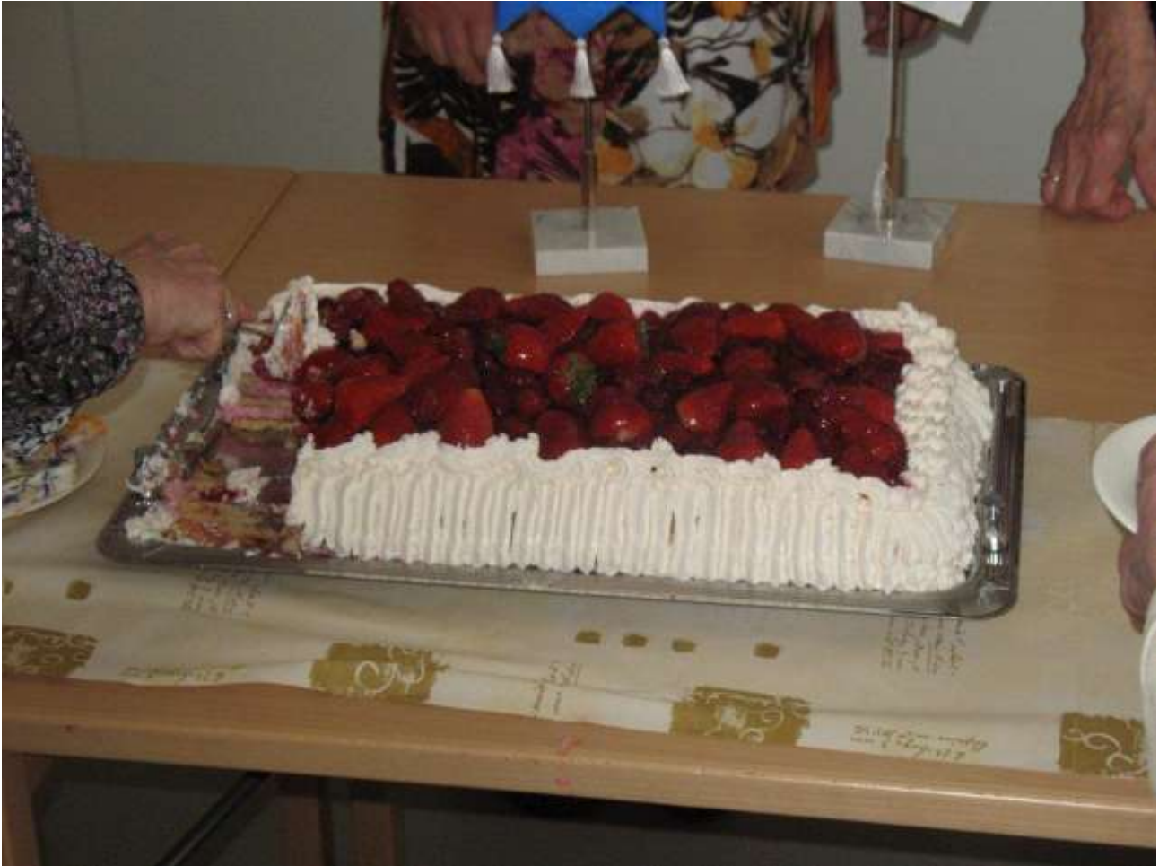
Onnea 10-vuotiaalle yhdistykselle pandemian aikana

Kiitämme Pitäjänmäen seurakuntaa sen käyttöömmme antamista tiloista ja kaikkia niitä, jotka ovat antaneet arpajaisiin palkintoja ja muutenkin tukeneet toimintaamme.