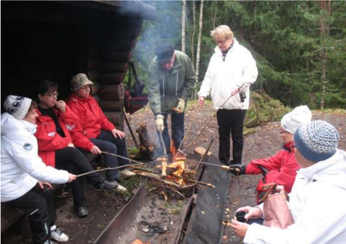
Sipoonkorven tulet ja makkaranpaistoa