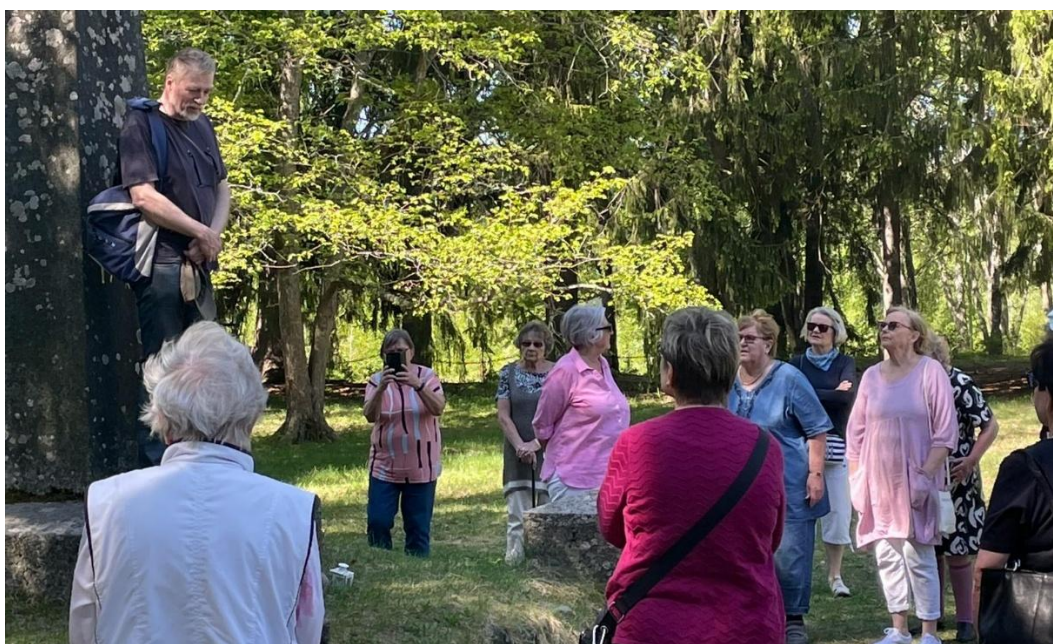
Puntari-kerhon retkellä 23.5.24 Pälkäneen nähtävyyksiä katsomassa.

8.5. Retki kimpakyydein (ohjelma ilmoitetaan myöhemmin)