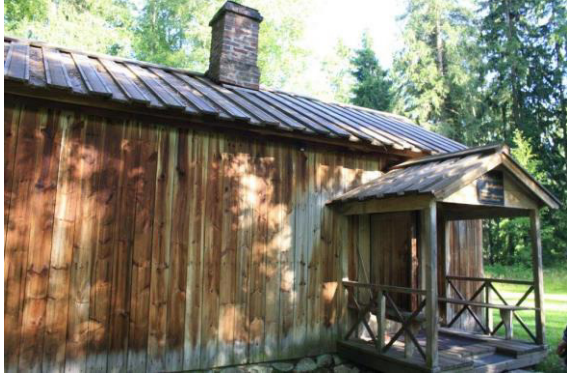
Klo 15.45-16.15 A.KIVEN KUOLINMÖKKI