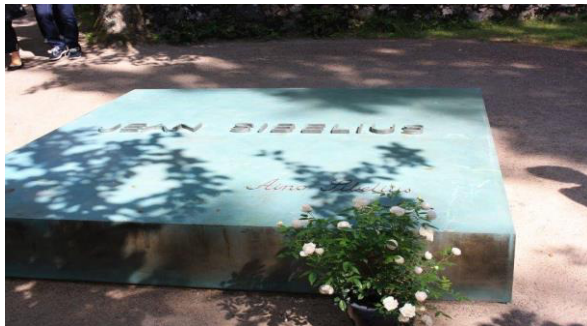
Klo 10-11 AINOLA

Klo 7.45-8.15 Piihovi, Salo (lyhyt taukopysähdys).