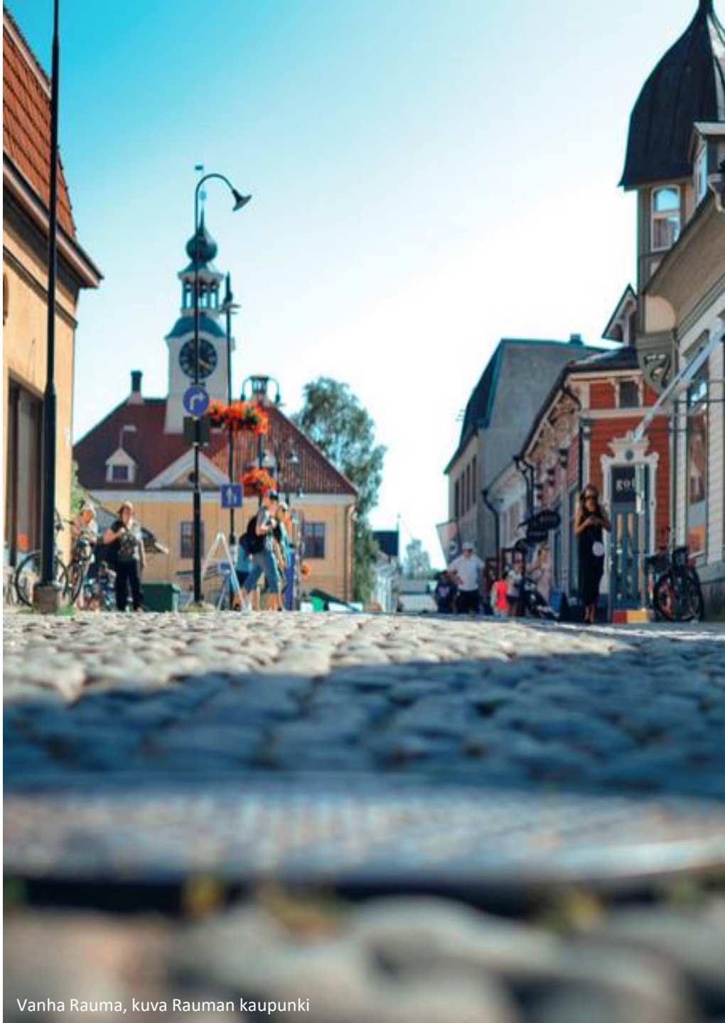
Vanha Rauma, kuva Rauman kaupunki