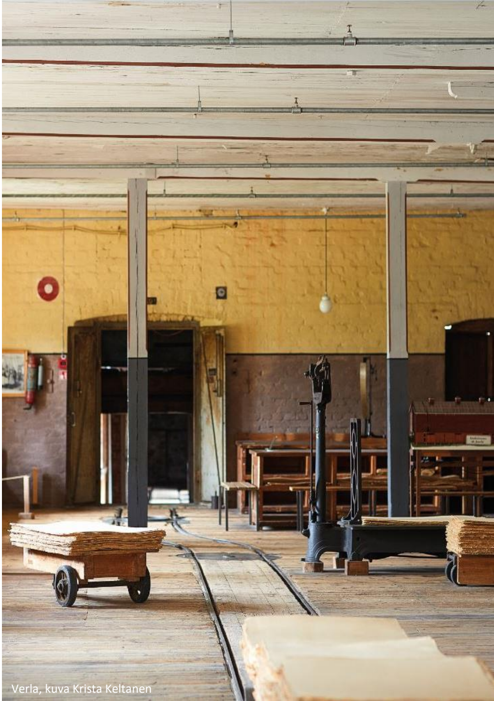
Verla, kuva Krista Keltanen