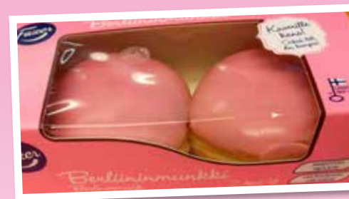
Tampereen Kristillisen koulun munkit