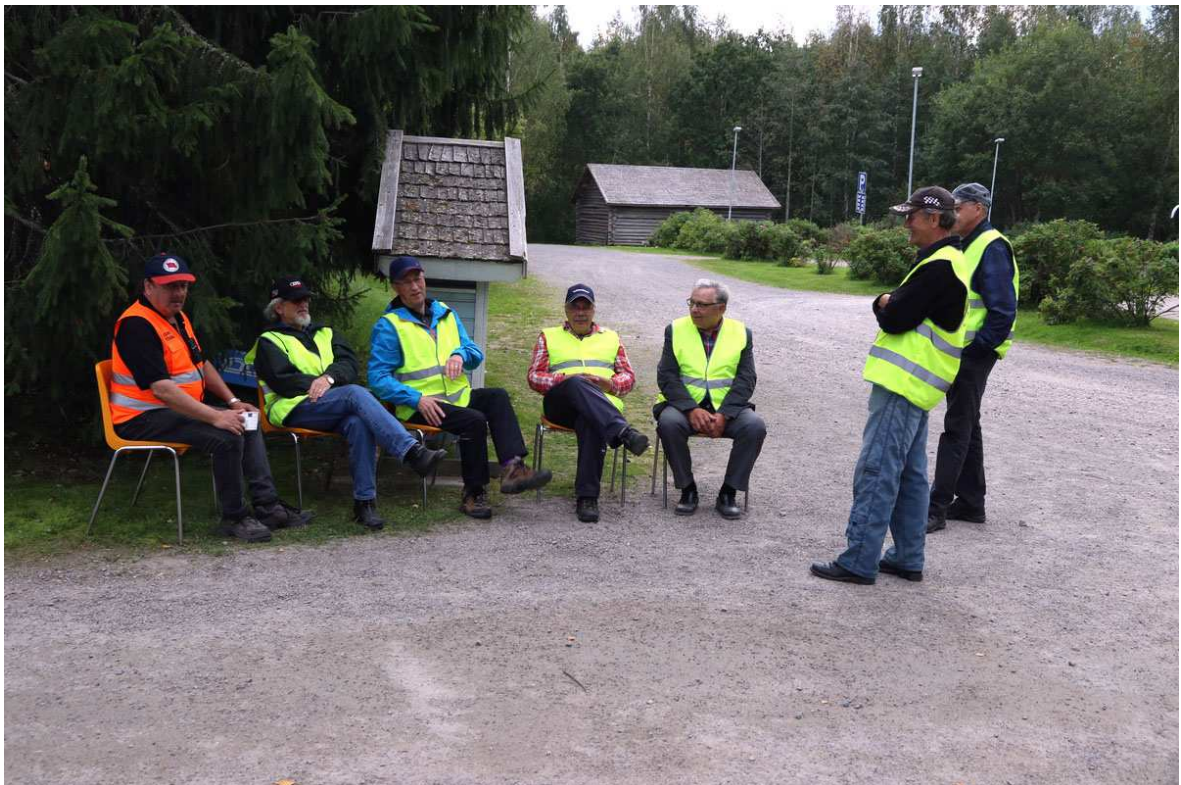
Rajaniemen 40-vuotisjuhlien valvojat ja ohjaajat "pihaportin" edessä.