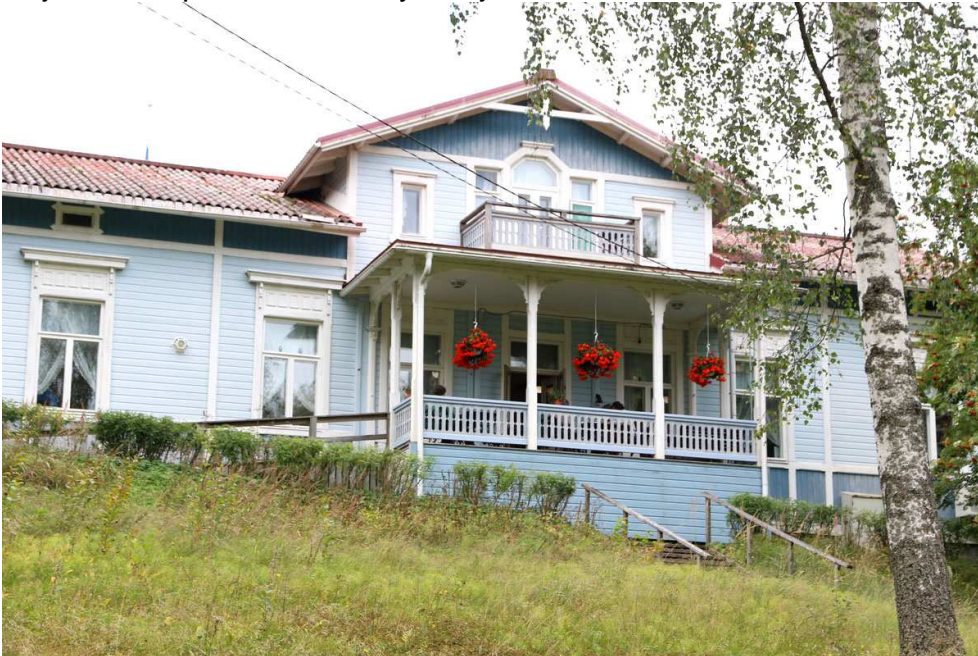
Rajaniemen Pytingin terassi.