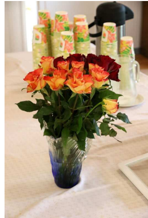
Pytingin edessä olevan kahvipisteen infotaulun ja kukat Piia siirtää varastoon.