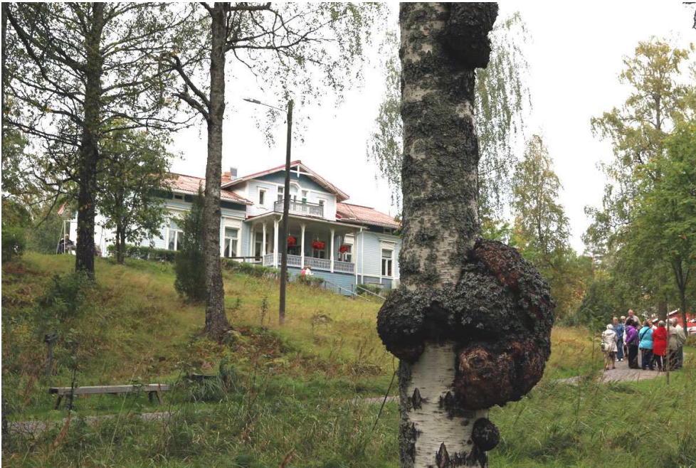
Rajaniemen päärakennus Pytinki järven rannalta kuvattuna.