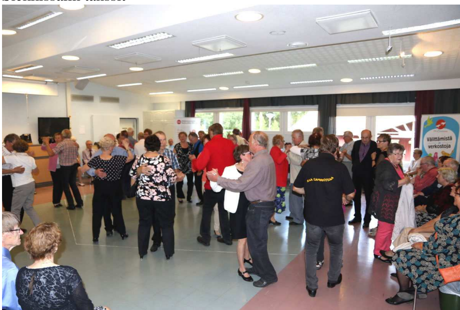
Siekkissalin tanssit 1.9.2016 klo 15-16.30