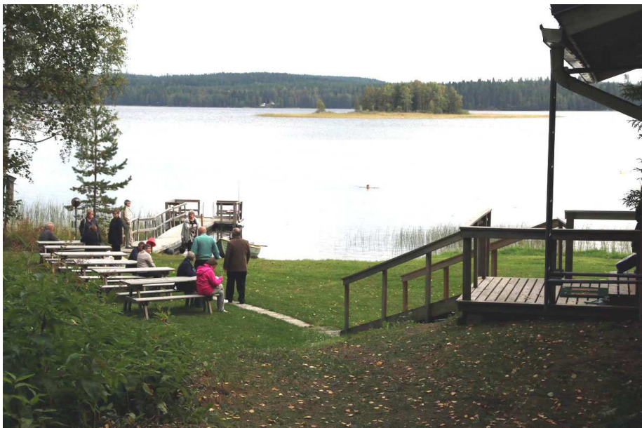
Rajaniemen lomakeskuksen rantasauna sijaitsee Siekkisjärven rannalla.