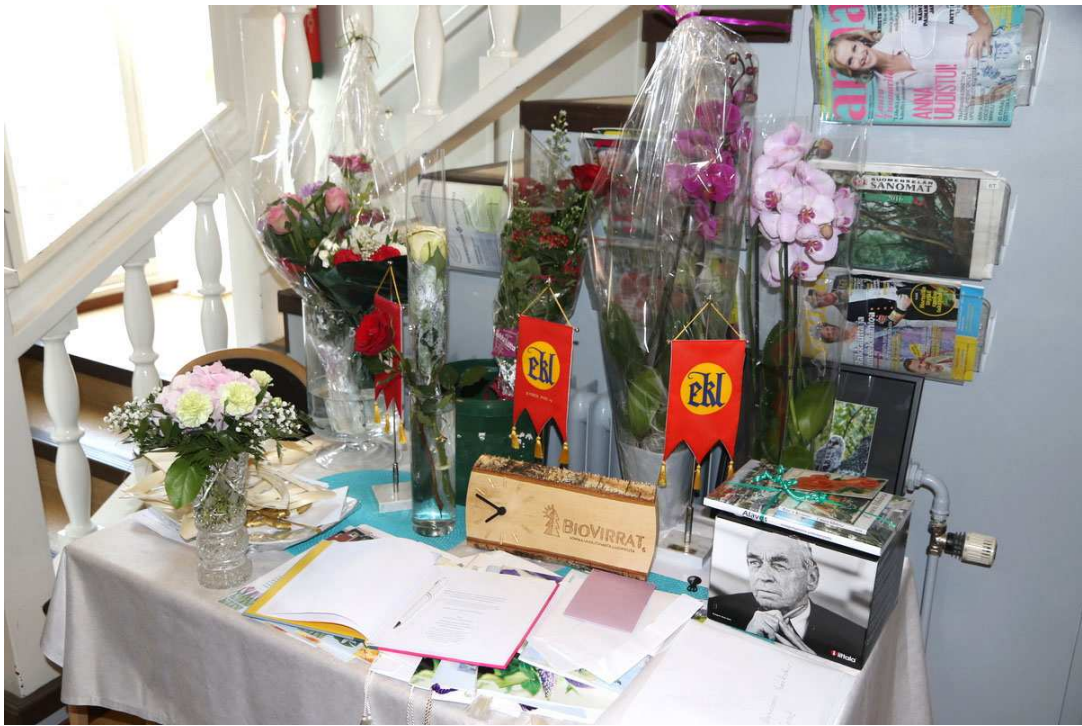
Kukkia, lahjoja ja onnitelukortteja päärakennuksen Pytingin eteisen pöydällä.