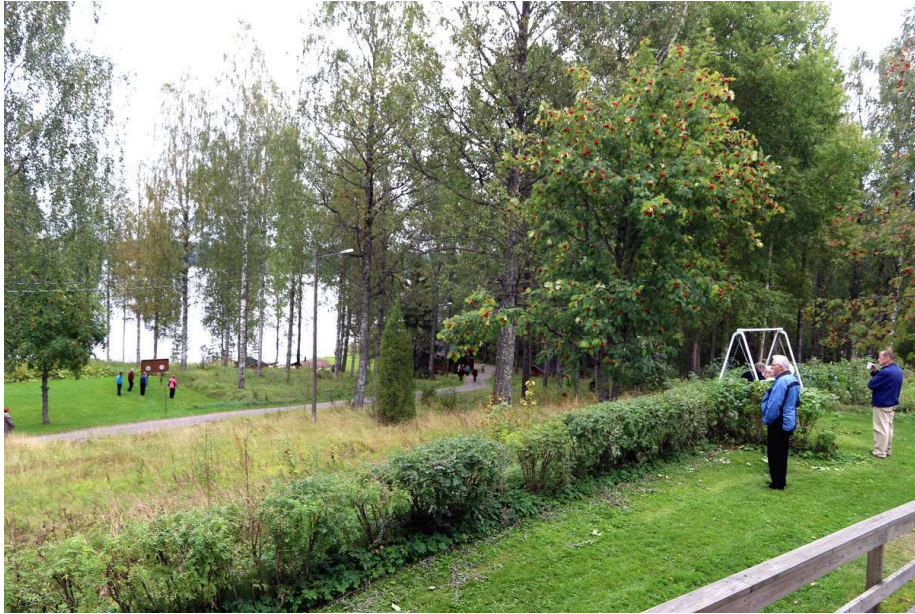
Rajaniemen lomakeskuksen puistoa.