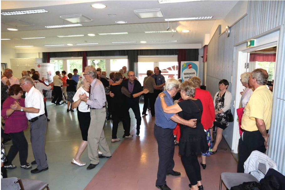
Tanssijoita riitti Siekkisalissa.