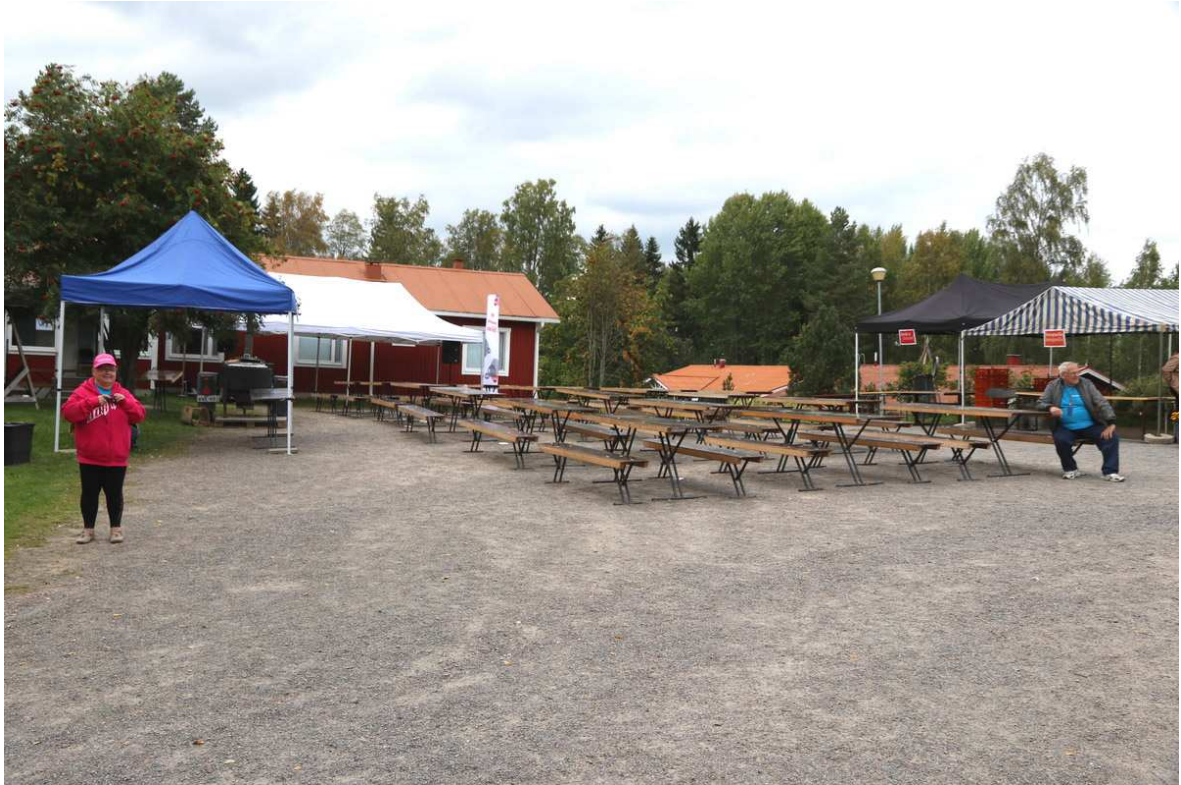
Tässä olivat 40-vuotisjuhlien pihaohjelman parhaat seurantapaikat.