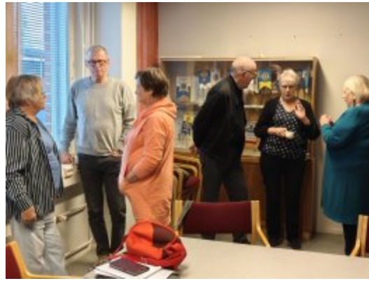
Paas poiketen koulutuksessa Kankaanpäässä 28.-29.10.

Ilmoittaudu viim. 25.11. TÄSTÄ Saat teams-linkin sähköpostiisi tapahtumaa edeltävänä päivänä.