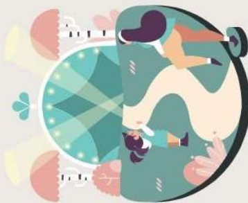
Muistelua ja visailua