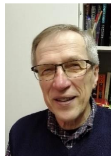
Georg Berström kirjanpito