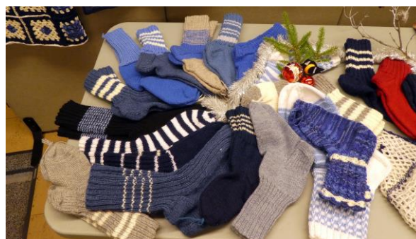
Näppärien käsien tuotos Suomi 100 v hengessä