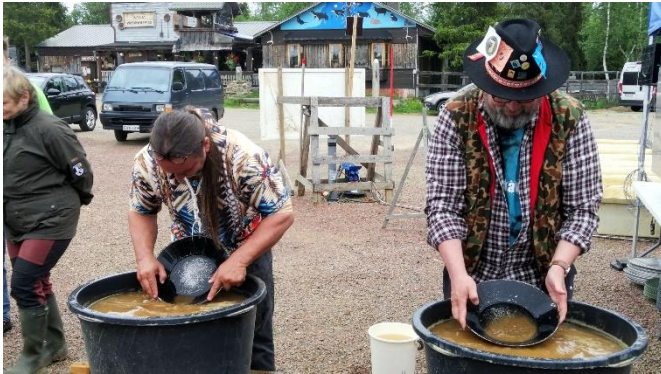
Meneillä Online vaskausten karsinta

Kilpailut alkoivat klo 14 Online karsinnalla. Lauantaina on loppukilpailu.