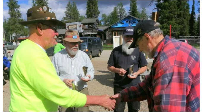
Kilpailujen puuhamies "Nopsajalka" jakaa palkinnot joukkuekilpailun voittajille