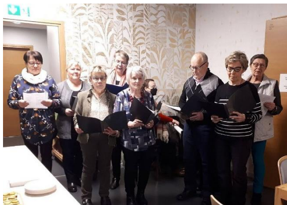
Söderkullan perjantaitapaamisessa (10.12.) laulettiin joululauluja. Myös Kansalaisopiston kuoro esiintyi, jonka kantavia voimia ovat eläkeläiset.

Ilmoita sähköpostiosoite, kotiosoite ja puhelinnumeromuutokset yhdistyksen jäsensihteerille; mattijkoski@iki.fi tai 040 5477 220. Voit tehdä ilmoituksen myös yhdistyksen kotisivulla: sipoon.elakkeensaajat.fi / Ota yhteys (yläpalkki). Tätä kautta tiedot kulkevat myös Eläkkeensaaja-lehdelle.