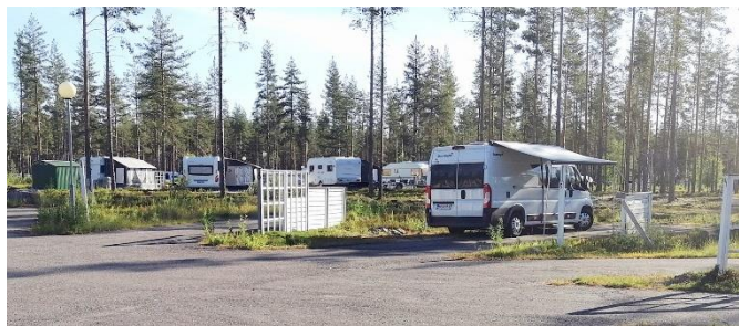
Aktive Camping Oulunjärvi