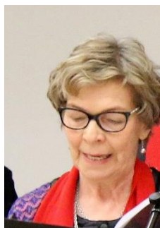
Hilikka Patala sihteeri