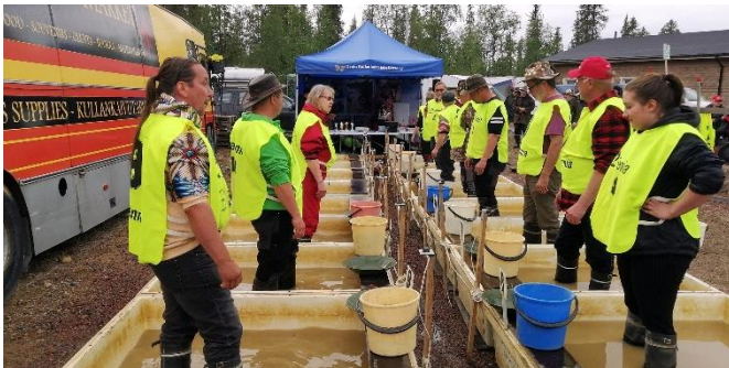
Kilpailijat valmiina otoksen

Itse osallistuin sarjaan yli 70-vuotiaat, joka osoittautui kisojen parhaimpien keskinäiseksi mitteloiksi.