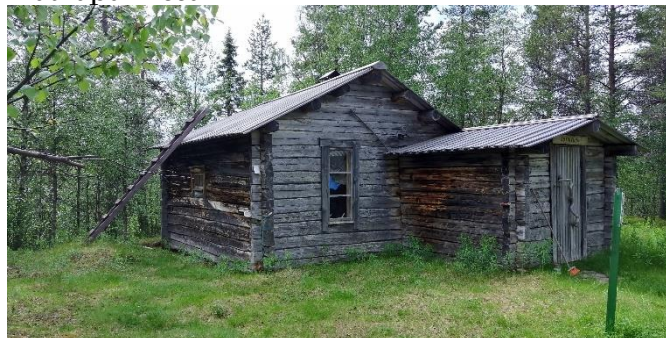
Mobergin ojan Kultalan rakennus

Seuraava yö vietettiin Saariselän Nesteen matkaparkissa.