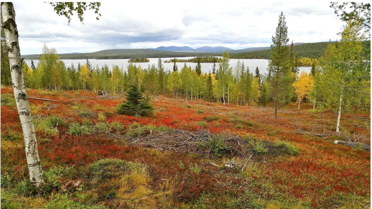
Kappale kaunista Suomea

Sipoon Eläkkeensaajat ry Sibbo Pensionstägare rf