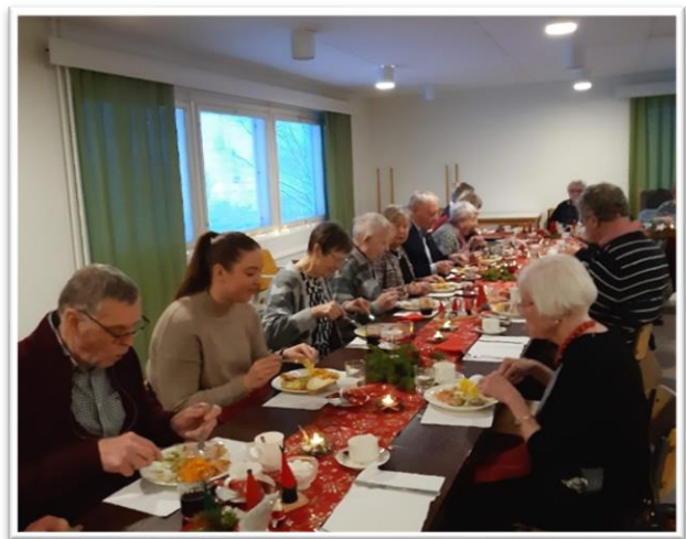
Kokkikerhon järjestämä joululounas 13.12.2022