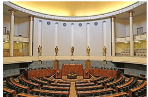
Eduskuntatalon istuntosali peruskorjauksen jälkeisessä asussaan vuonna 2017.