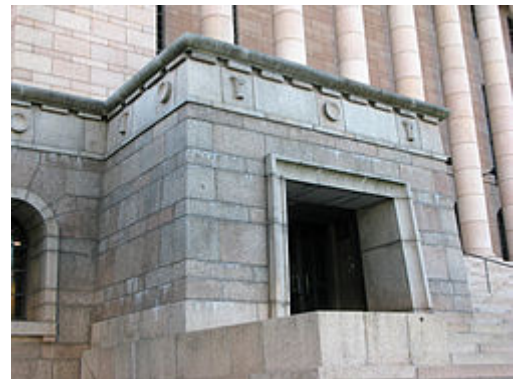
Lehteriyleisön entiset sisäänkäynnit ovat pääportaiden molemmin puolin.

Eduskuntatalon julkisivujen ulkoverhoilussa käytettiin kotimaista Kalvolan punertavanharmaata graniittia , jonka katsottiin ilmentävän hyvin rakennuksen lujaa kansallista luonnetta. Julkisivujen friisien klassistiset koristeaiheet samoin kuin pääfasadin ikkunoiden ja ovien yläpuolella olevat tyyllitellyt leijonapäät pohjautuivat Gunnar Finnen luonnoksiin. Talon graniittitöitä on pidetty suomalaisten kivenhakkaajien mestarinäytteenä. [13]