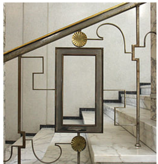
Sisätilojen art deco -koristelua.