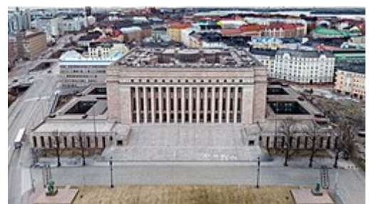
Ilmakuva eduskuntatalosta vuonna 2020. Kuvassa näkyvät sivuille rakennetut matalammat laajennusosat.