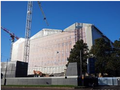
Eduskuntatalon peruskorjaus käynnissä syksyllä 2015.

Eduskunnan käytössä olevat eri kiinteistöt peruskorjattiin vuosina 2007-2017. Itse Eduskuntatalon peruskorjaus alkoi keväällä 2015. Viimeinen peruskorjausta edeltävä täysistunto Eduskuntatalossa pidettiin 14. maaliskuuta 2015. [5] Päärakennusremontin ajan eduskunta kokoontui väistötiloissa viereisen Sibelius-Akatemian konserttisalissa. [6] Tavoitteena oli saada korjaustyöt valmiiksi vuoteen 2017 mennessä, jolloin vietetään Suomen itsenäisyyden satavuotisjuhlaa. [7]