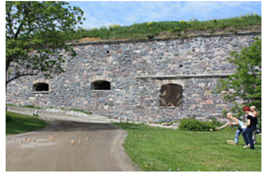
Mölkyn pelaajia Suomenlinnassa

Mölkyn joukkueiden SM-kilpailut on järjestetty Lahdessa vuodesta 1997 lähtien, järjestäjänään Etelä-Hämeen Nuorisoseurojen liitto. Vuodesta 2004 lähtien SM-kilpailut ovat olleet myös MM-kilpailut. Tampereen tekkarit järjestivät Akateemisen Mölkyn MM-kilpailut Tampereella vuonna 2001. Vuodesta 2008 alkaen Akateemisen Mölkyn MM-kilpailuiden järjestämisestä Turussa on vastannut osana Turun akateemista vappua oikeustieteilijöiden ainejärjestö Lex ry. Mölkyn ja sen pelikulttuurin edistämiseksi on perustettu Suomen Molkkyliitto.