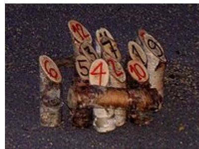
Mölkky osumassa maalikeiloihin

Mölkky on heittopeli, joka on kotoisin Päijät-Hämeestä. Se muistuttaa idealtaan ja välineiltään karjalaisten vuosisatoja vanhaa peliä kyykkää. Mölkky ei ole kuitenkaan yhtä fyysinen kuin kyykkä, ja se sopii kaiken ikäisille ja kuntoisille. kenen mukaan? Mölkkyssä menestykseen tarvitaan vain yksinkertaiset välineet ja sopivassa suhteessa sekä taitoa että onnea. Mölkkyä voivat pelata tasapäisesti yhdessä sekä nuoret että vanhat, ja siitä onkin tullut suosittu peli etenkin kesämökeillä. Brio myy mölkyn kopiopeliä nimellä "Mökkipeli", jonka säännöissä on pieniä eroja perinteiseen mölkkyyn.