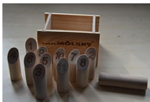
Taskumölkky-versio, jossa heittokapula on noin kuuden senttimetrin pituinen.