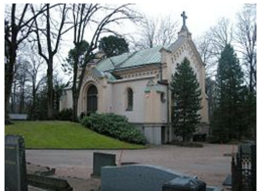
Hietaniemen hautausmaan vanha siunauskappeli.

Lisää rakennusartikkeleita Arkkitehtuurin teemasivulla