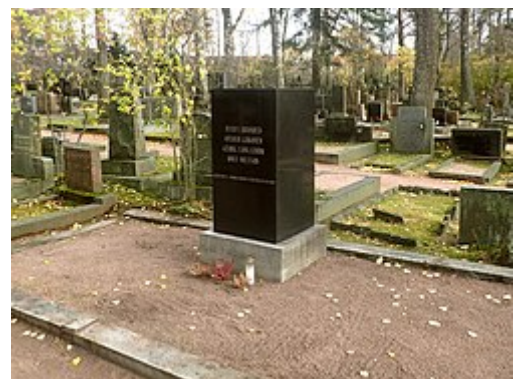
Viron vapaussodassa 1919 kaatuneiden vapaaehtoisten muistomerkki