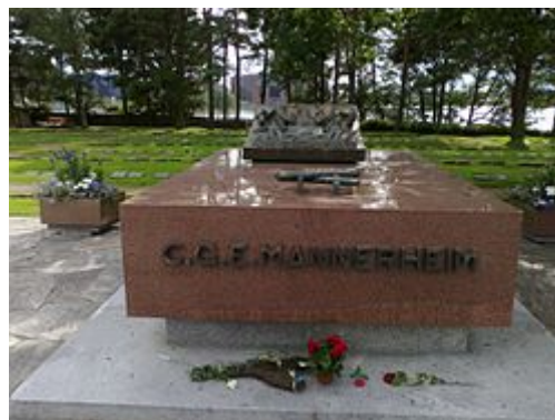
Mannerheimin hauta sijaitsee Sankariaukiolla.