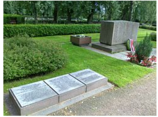
Saksalaisten kaatuneiden muistomerkki (ylh. oik.) ja saksalaisen miinalaiva "Königin Luisen" onnettomuudessa hukkuneiden muistomerkki (alh.vas.)