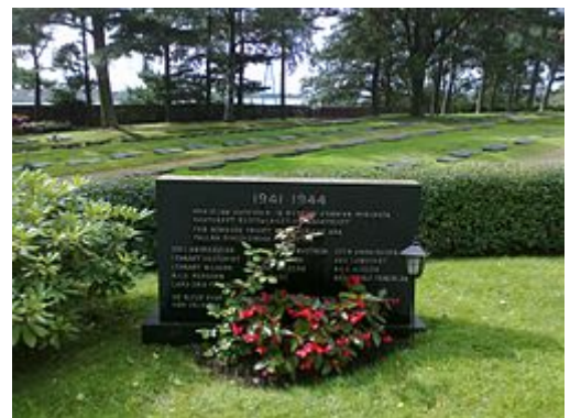
Ruotsalaisten vapaaehtoisten muistomerkki Hietaniemen alueella lähellä Sankariaukiota.