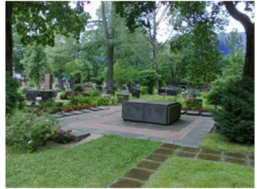
Suomen Kaartin hautausmaa.