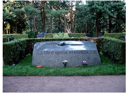
Urho Kekkosen hauta sijaitsee uuden kappelin lähellä.

Pääartikkeli: Luettelo tunnetuista Hietaniemen hautausmaalle haudatuista henkilöistä