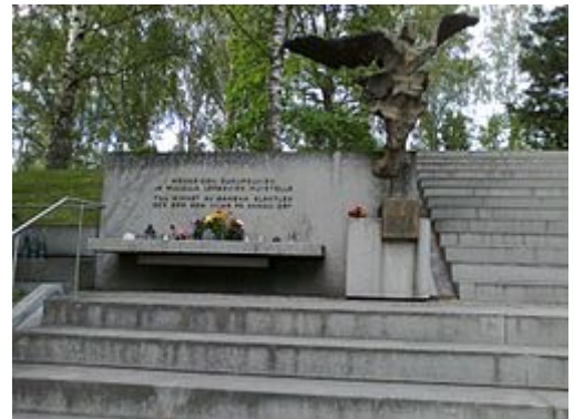
Menneiden sukupolvien ja muualla lepävien muistomerkki