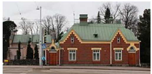
Vahtimestarin entinen asunto Mechelininkadun portin vieressä.