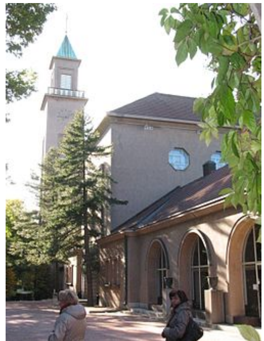
Hietaniemen hautausmaan uusi siunauskappeli ja oikealla kolumbaario .