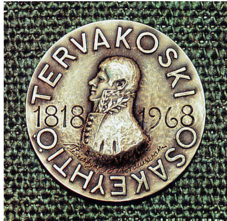
Juhlan kunniaksi julkaistiin postimerkki ja juhlakolikko.