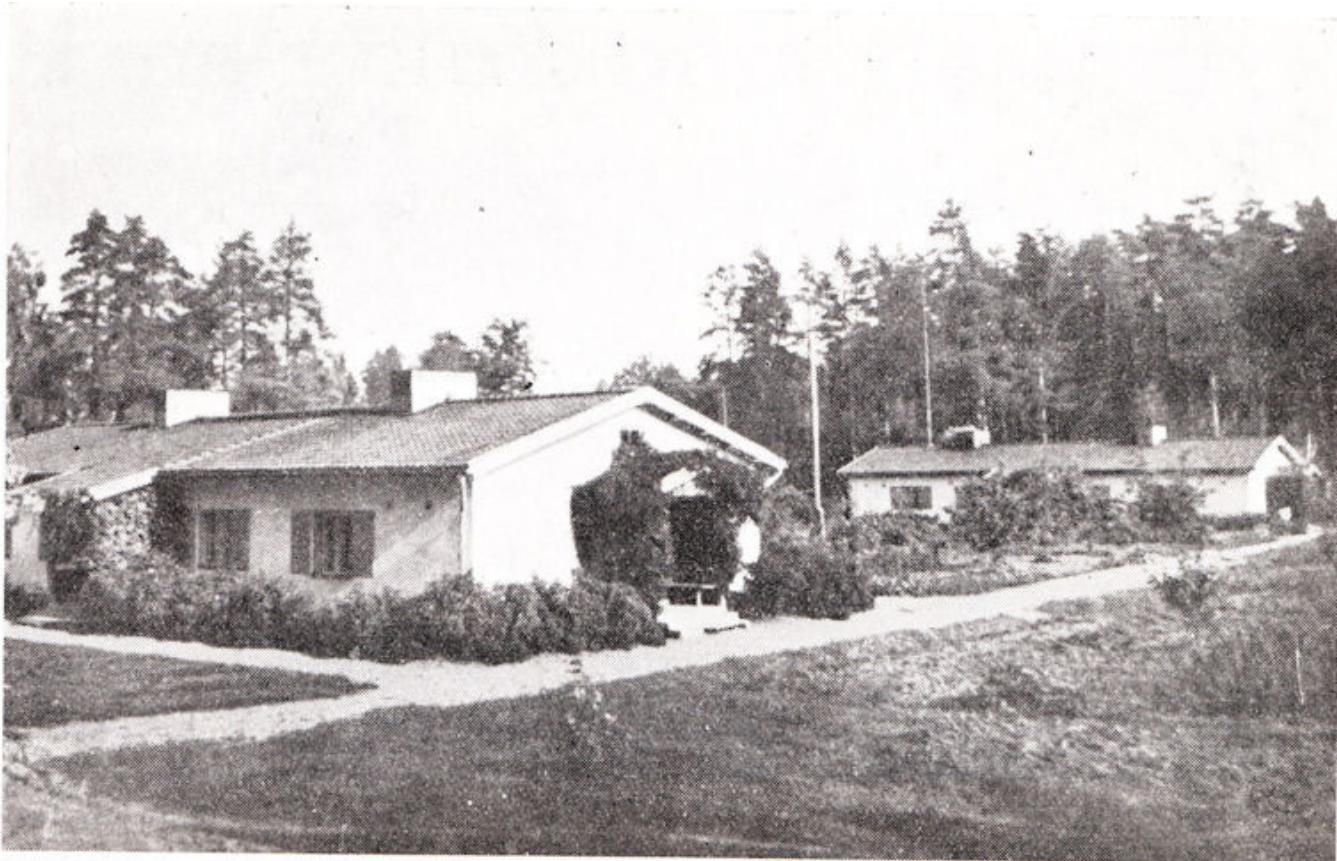
Eläkeläisille rakennettiin omat asunnot, Lepolaan.

Venäläiset sotavangit rakensivat Ruotsalaisten lahjoittamat talot.