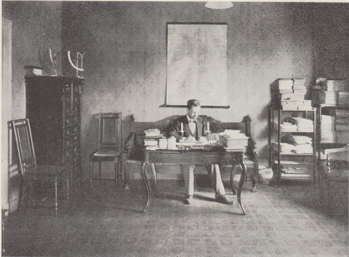
Leonard Wasenius isänsä apulaisena

siitä, että ei jouduta samanlaiseen tilanteeseen kuin yhtiön alkuvuosina, jolloin käteisten varojen niukkuuden takia oli otettava lainoja henkilötakausiakin vastaan, minkä Wasenius silloin tunsu suorastaan nöyryyttävänä.